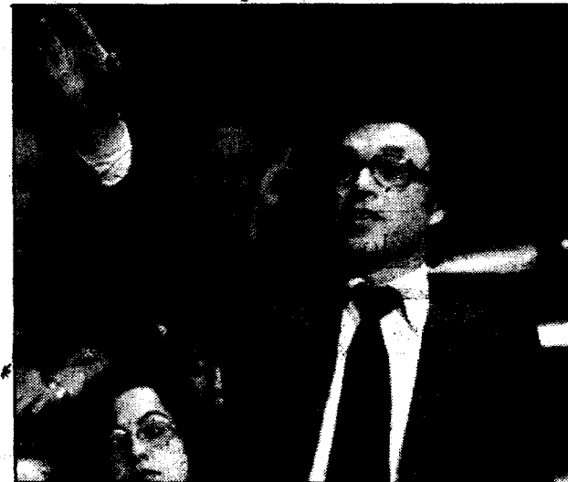
Solé Tura (PCE), en contra.

En su opinión, el artículo 168 no se protege a sí mismo en términos expresos de la reforma constitucional por la vía del artículo 167, «lo que deja al menos, abierta la puerta a una interpretación más o menos discutible de que cabe reformar el contenido especialmente protegido por el artículo 168 en dos tiempos, de forma que una primera ley de reforma constitucional —elaborada y aprobada por el artículo 167— reforme el artículo 168, para después