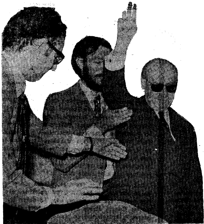
Tierno: el hermano separado del Meliá