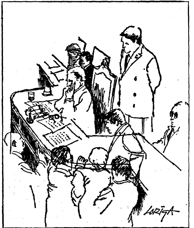
Los diputados se arremolinan ante la mesa del presidente al darse cuenta de que están marcando mal los votos

sesión durase más de cinco horas cuando pudo quedar en tres. Siendo ya bastante tarde, el señor Fraga Iribarne pidió la suspensión de la sesión hasta el día siguiente, pero, sometida esta cuestión al parecer de todo el Congreso, fue derrotada en una votación que también llevó su tiempo y sus discusiones previas. Por si faltaba algo, Alianza Popular tenía presentado, fuera del plazo que establece el actual Reglamento, un voto particular que no pudo ser defendido por la negativa socialista. El voto particular hacía referen-