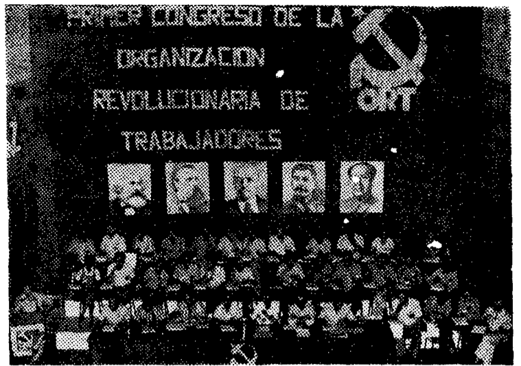
Vista general de la mesa del congreso. (Torremocha.)

—Creemos que la significación que va a tener la celebración de este congreso para la clase obrera va a ser muy importante, porque vamos a hacer en nuestro congreso un partido M-L más fuerte. Partido que la clase obrera necesita para cumplir sus