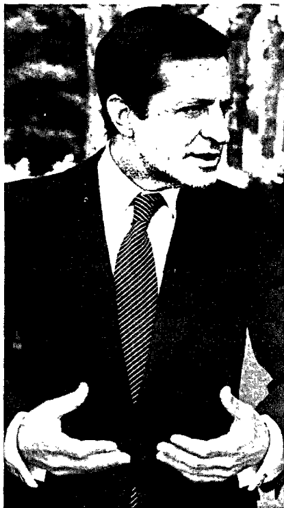
Le Premier ministre, M. Adolfo Suárez.

ration avec fermeté, mais dans l'effacement. A aucun moment il n'a cherché à retirer ostensiblement pour lui-même les bénéfices de cette évolution, préférant laisser à son chef de gouvernement, Adolfo Suárez, l'honneur d'en recevoir les lauriers. Quand le Roi ne lui téléphone pas, ce dernier s'inquiète : « Pourquoi ne m'appellez-vous pas ? — Je suis fâché... — Mais pourquoi êtes-vous fâché ? insiste M. Suárez. — Tu te tues au travail, répond le