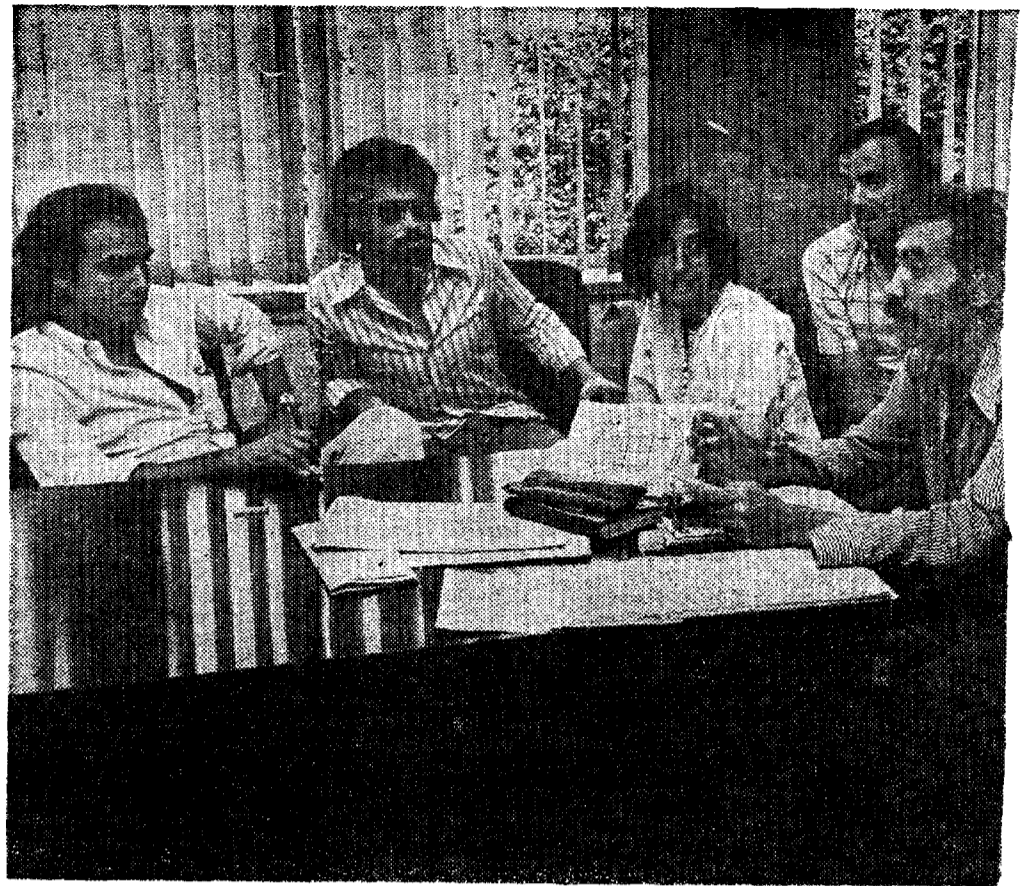
Abogados y miembros de COPEL, unidos en las

"No creemos —culminaron— que los presos ceden en su lucha, en tanto no se atiendan sus justas reivindicaciones."