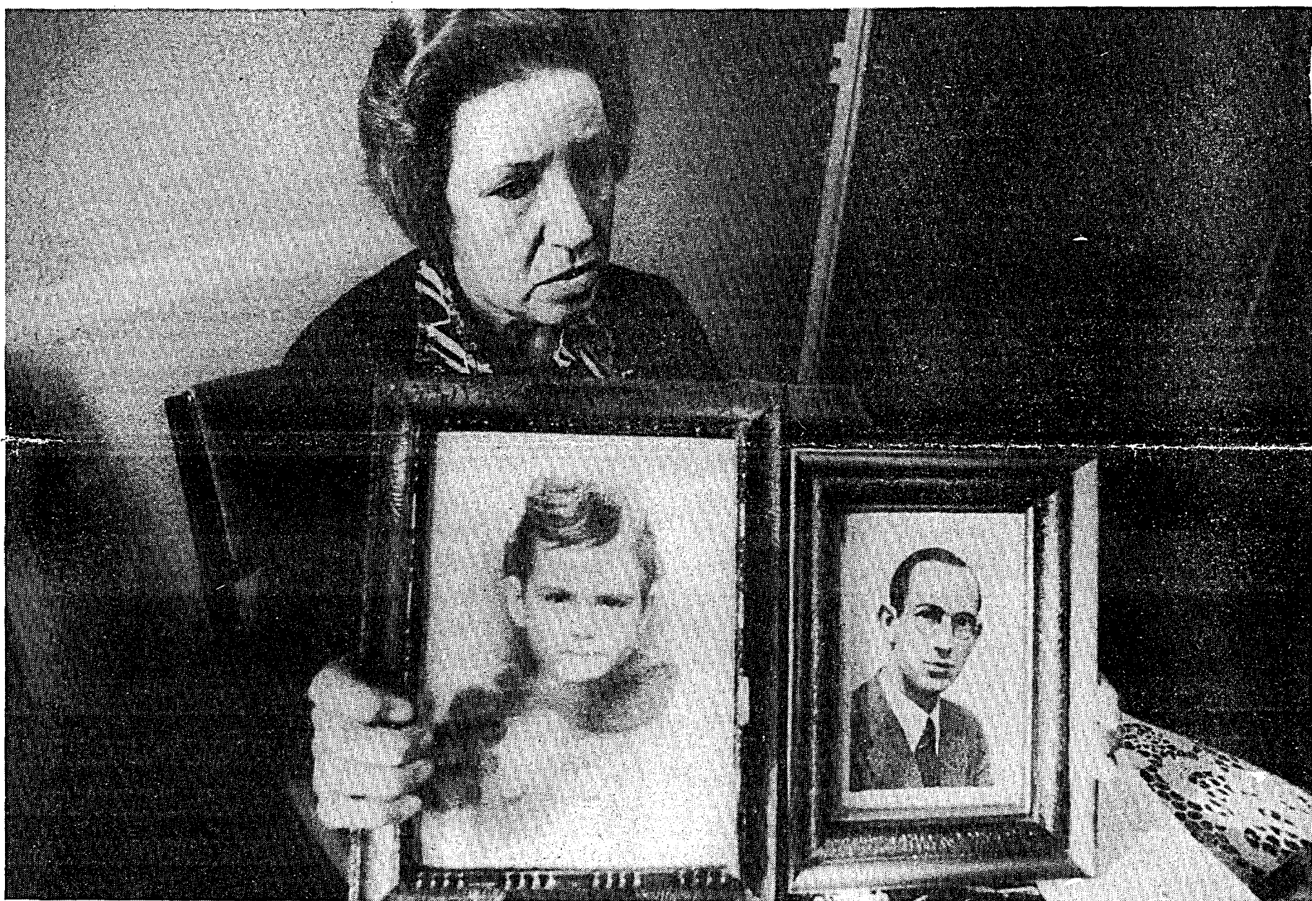
Dos fotos quedaron de recuerdo: la de su hija y la de su marido. Los dos están muertos

Texto: Ricardo Cid Cañaverall