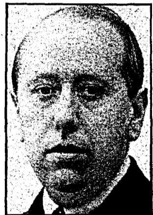
José María Gil Robles en su época de jefe de la CEDA

Sin haberse declarado republicano antes del 14 de abril de 1931, Portela es uno de los hombres de la República. En ella desempeña el