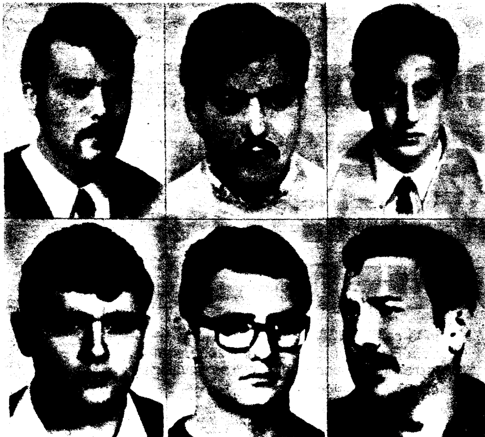
A los pocos días del criminal atentado, la Policía identificó a los seis presuntos autores del mismo.