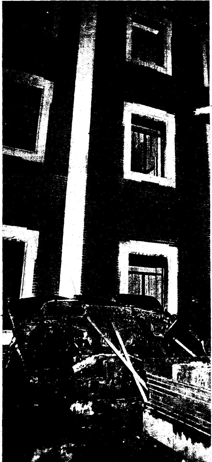
Totalmente destrozado quedó el coche presidencial en la terraza interior de la residencia de los jesuitas.