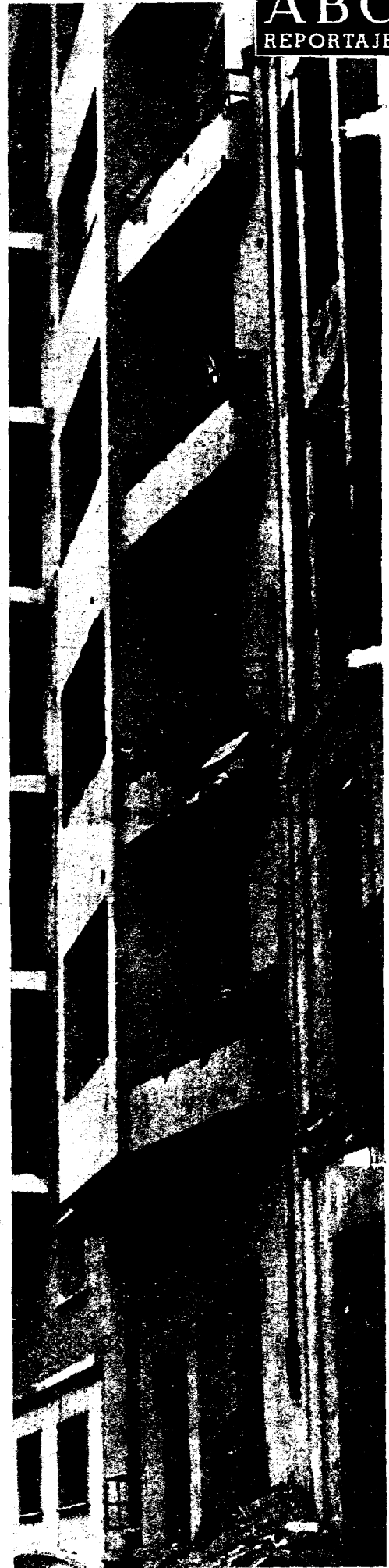
Desde el sótano de esta finca de la calle Claudio Coello, 104, se perforó el túnel para colocar la carga explosiva bajo la calza.