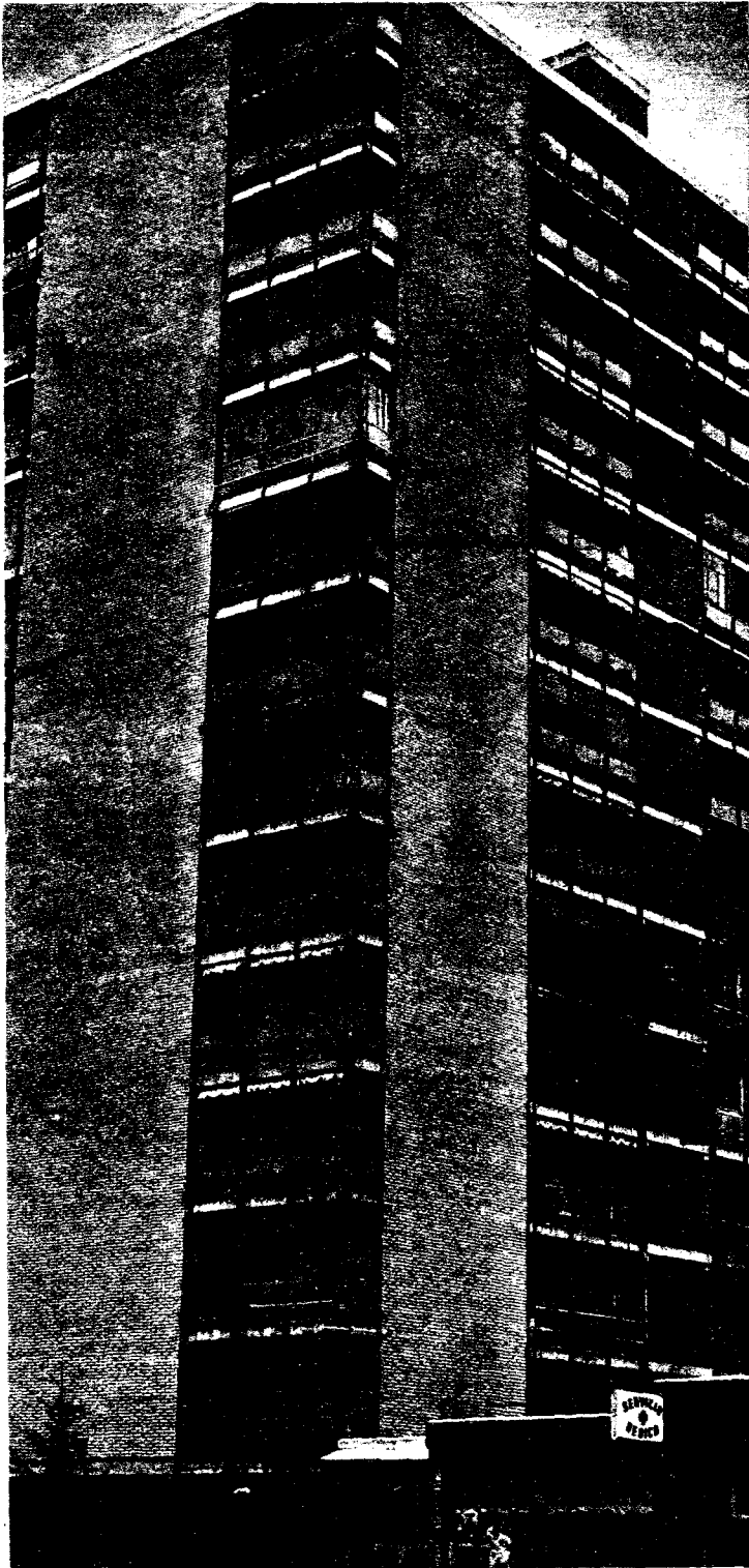
El edificio de la calle Mirlo, 1, donde vivieron los terroristas de E. T. A. identificados por la Policía como culpables del monstruoso atentado.

Criminalidad vulgar y común, decimos, sin que valgan en su disculpa motivos o fines políticos de ninguna clase. Eso, para nosotros, no cuenta y, para los muertos, menos aún. «Los autores son simplemente unos asesinos y como a tales hay que tratarlos».