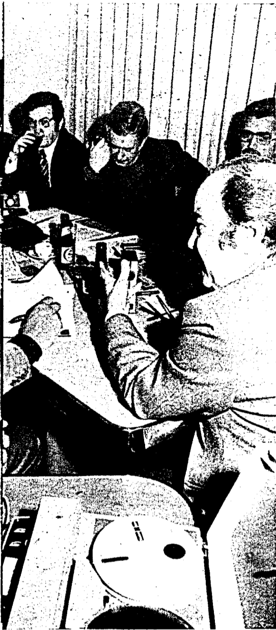
ARDONA (derecha).—«Es verdaderamente extraordinario que el diario ARRIBA haya venido esta idea de reunirnos a todos y que esto no haya sucedido hasta ahora»

Siempre que en el Ejército, en los hospitales, en los establecimientos penales o en otros centros públicos cualesquiera exista la necesidad de culto y cura de almas, las sociedades religiosas serán admitidas para proceder a actos religiosos, debiendo abstenerse de toda coerción.