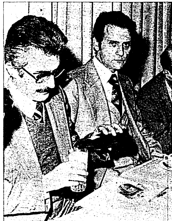
De izquierda a derecha: POVE

rra una gran parte de la historia, especialmente triste para las minorías religiosas, que han sufrido la intolerancia y las dificultades de la disidencia religiosa, recogida en la ley de Orden Público. Por tanto, saludamos con alegría esta manifestación de libertad religiosa en la Constitución. Pero si ésta no tiene