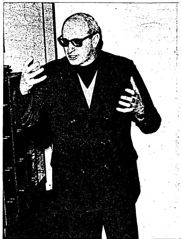
CORRAL (JESUITA) Y BARRIO (MUSULMAN), rompámonos las cabezas y entonces vivamos