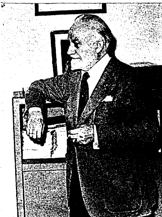
MAN). — «Y yo digo, señores, pensémoslo digamos algo genial. ¡Los españoles nos oíde todo!»