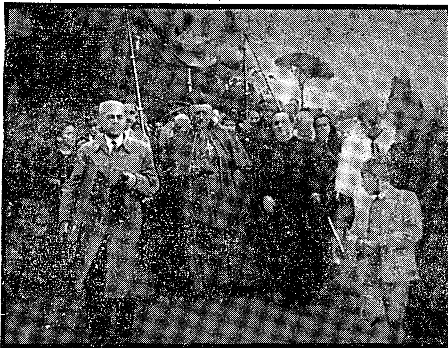
petrar la divina misericordia, conforme a lo que dispusimos en nuestra circular del día 15 de abril.