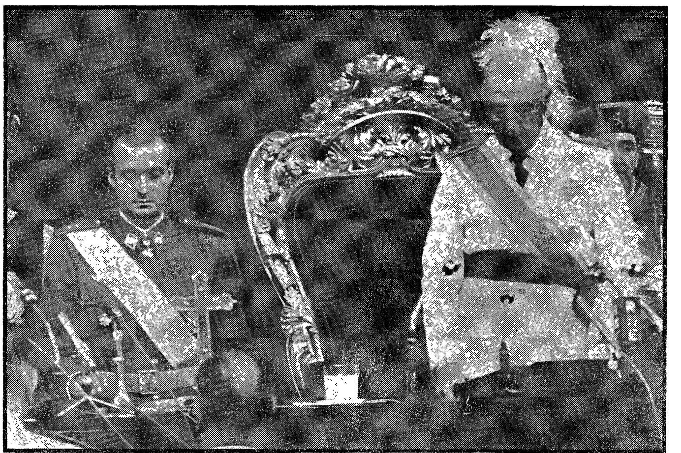
El Príncipe Don Juan Carlos de Borbón presta juramento ante las Cortes.