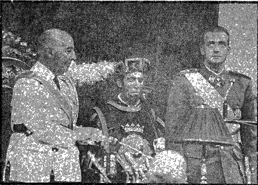
Su Excelencia el Jefe del Estado y Generalísimo de los Ejércitos se suma a los aplausos tributados al Príncipe Juan Carlos de Borbón, después de los discursos.