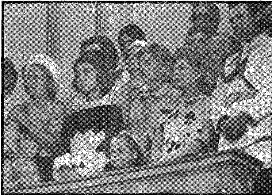
En un palco, la Princesa Sofía, las Infantas Elena y Cristina y el Príncipe Alfonso de Borbón Dampierre.