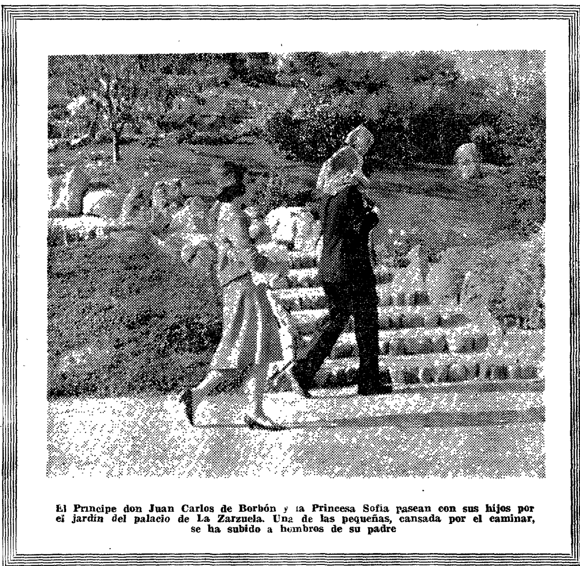
El Príncipe don Juan Carlos de Borbón y la Princesa Sofía pasean con sus hijos por el jardín del palacio de La Zarzuela. Una de las pequeñas, cansada por el caminar, se ha subido a hombros de su padre.

Por la sucesión dinástica y la reunión de varias familias reales de Europa, el príncipe don Felipe, hijo de Su Alteza don Juan Carlos de Borbón y Borbón, Príncipe de España, desciende en línea directa, y por ambas ramas, de la Reina Victoria de Inglaterra. En efecto la Reina Victoria Eugenia de España esposa del Rey don Alfonso XIII y abuela de don Juan Carlos, era nieta de la Reina Victoria de Inglaterra. Por su parte, la princesa Sofía de Grecia, hoy princesa de España por su matrimonio con don Juan Carlos de Borbón, es, asimismo, nieta del Kaiser Guillermo II de Alemania, nieto, a su vez, de la Reina Victoria de Inglaterra. El príncipe Felipe por tanto, descendiente en línea directa de los Reyes de España, es asimismo descendiente, tanto por su rama paterna como por la materna, de la Reina Victoria, de Gran Bretaña.