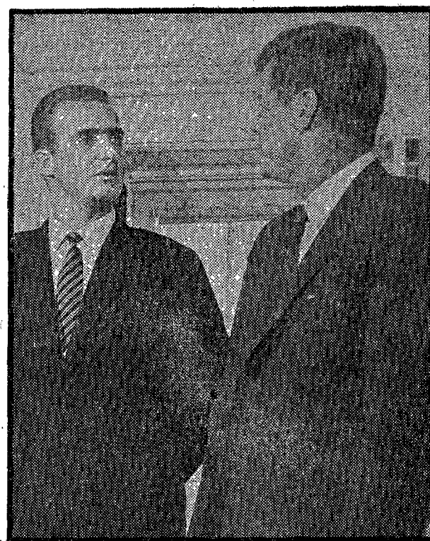
En su visita a Estados Unidos en 1963, Don Juan Carlos conversa con el presidente Kennedy en la Casa Blanca.