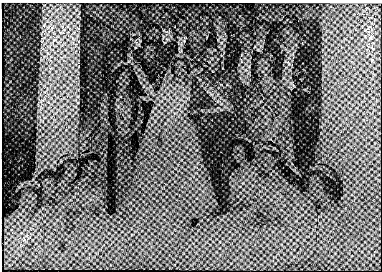
Rodeados de las damas de honor y reyes y príncipes de toda Europa, después de su boda, celebrada el 5 de mayo de 1962 en Atenas.