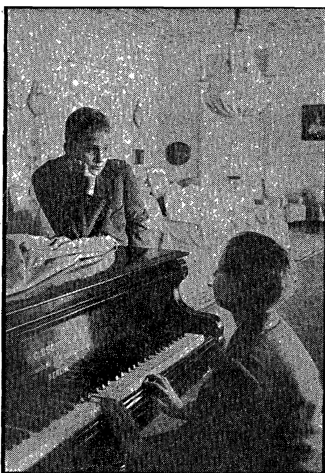
El Príncipe, acompañado de su hermano don Alfonso, visita una de las salas cerradas del Palacio Real, en sus tiempos escolares.