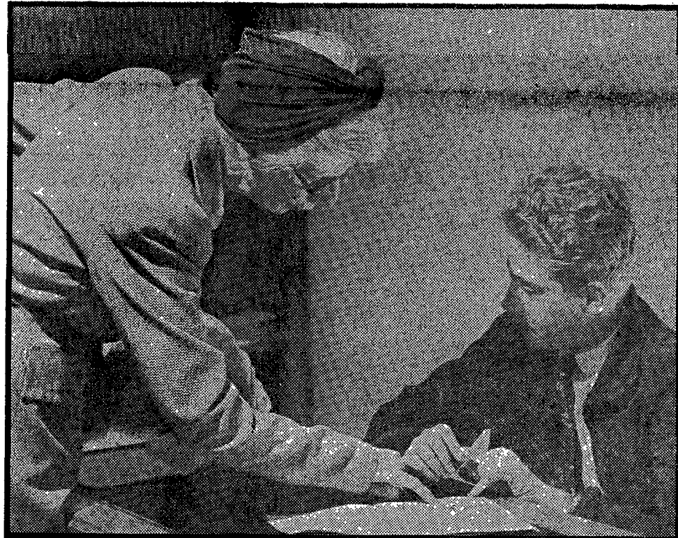
El Príncipe recibe clases de inglés en el palacio de Miramar, de San Sebastián.