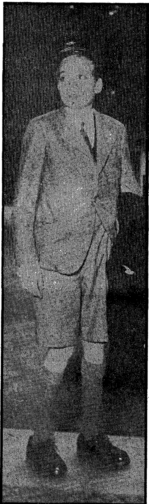
1948: El Príncipe Don Juan Carlos llega a Madrid para iniciar sus estudios de Bachillerato. Tiene entonces diez años.