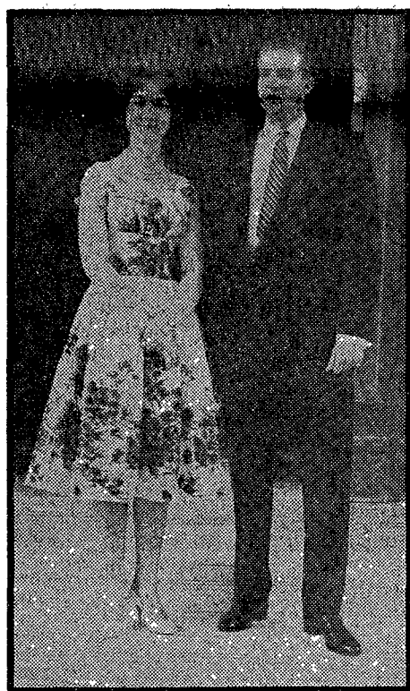
Los Príncipes Juan Carlos y Sofía fotografiados en Atenas, durante su época de noviazgo.