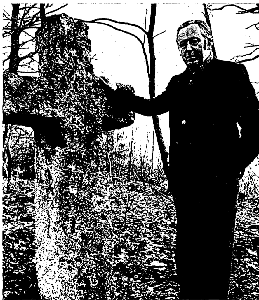
El autor, en el despacho de su casa, que utiliza como lugar de trabajo