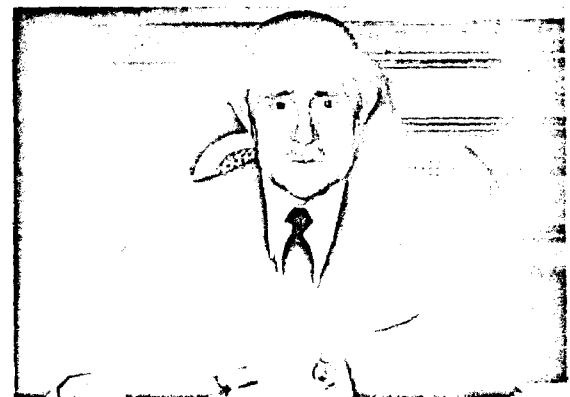
ARIAS: TODO SIGUE ADELANTE.

"No vengo a cerrar nada que esté abierto o a parar nada que esté en marcha" dijo el ministro. Vengo a practicar una política de puertas abiertas para que entre el aire limpio y fresco de la calle. La Administración necesita abrir puertas y ventanas y recibir el aire limpio de la crítica de la calle, aspecto que le obliga muchas veces a rectificar errores. Vengo a practicar una Administración dialogante porque creo que el diálogo es