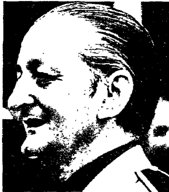
VICEPRESIDENTE Y S. G. MOVIMIENTO Don Torcuato Fernández Miranda