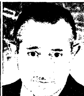
GOBERNACION: Don Carlos Arias Navarro