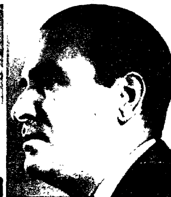
OBRAS PUBLICAS: Don Gonzalo Fernández de la Mora