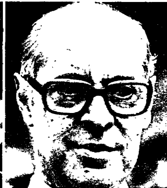
ASUNTOS EXTERIORES: Don Laureano López Rodó