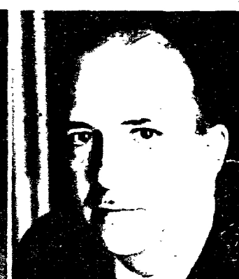
SUBSECRETARIO DE LA PRESIDENCIA: Don José María Gamazo