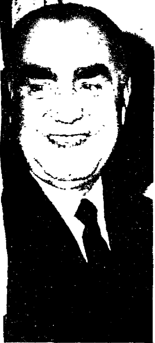
PRESIDENTE: Don Luis Carrero Blanco