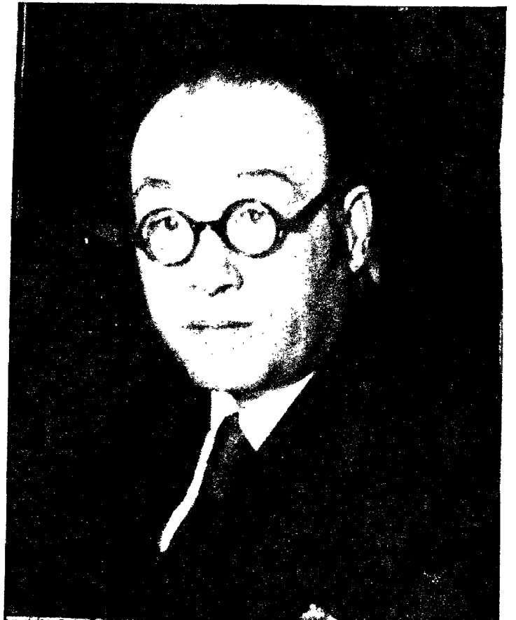
Antes y después de su ordenación sacerdotal, don Manuel García Morente, catedrático de Ética, enseñó y escribió con claridad meridiana. Sus "Fundamentos de Filosofía" y su "Idea de la Hispanidad" acreditan una exposición rigurosa y un estilo cristalino.