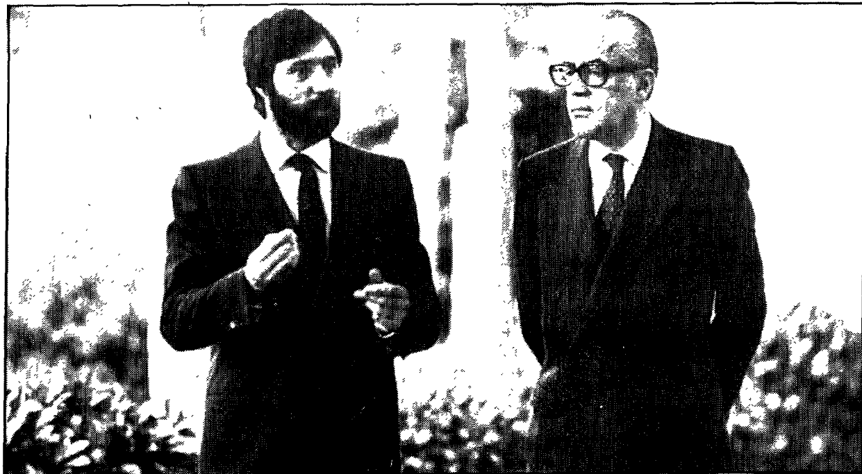
El periodista mantiene un diálogo inesperadamente desinhibido con un presidente jovial, hasta risueño.