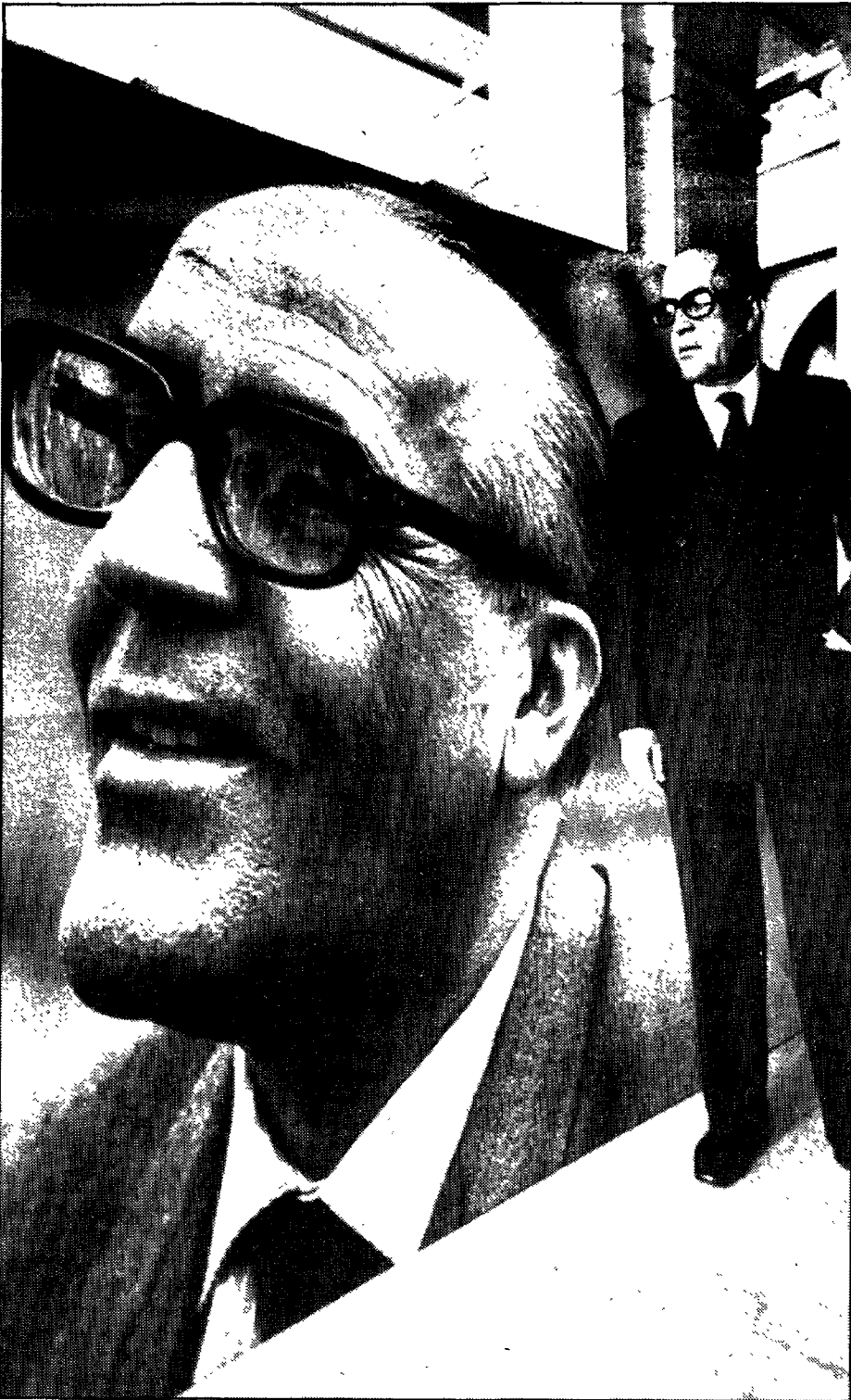
También las elecciones han llegado a palacio. El enorme retrato pone un toque felliniano en la sala de columnas.

Aguirre. El diálogo —no sé si a causa de la inminencia del relevo—, tiene lugar con un presidente inesperadamente jovial y desinhibido. El tuteo fluye con naturalidad en la conversación —que a veces se tensa ante las aristas de una pregunta—, aunque la dignidad del cargo reclame el «usted» para las transcripciones.