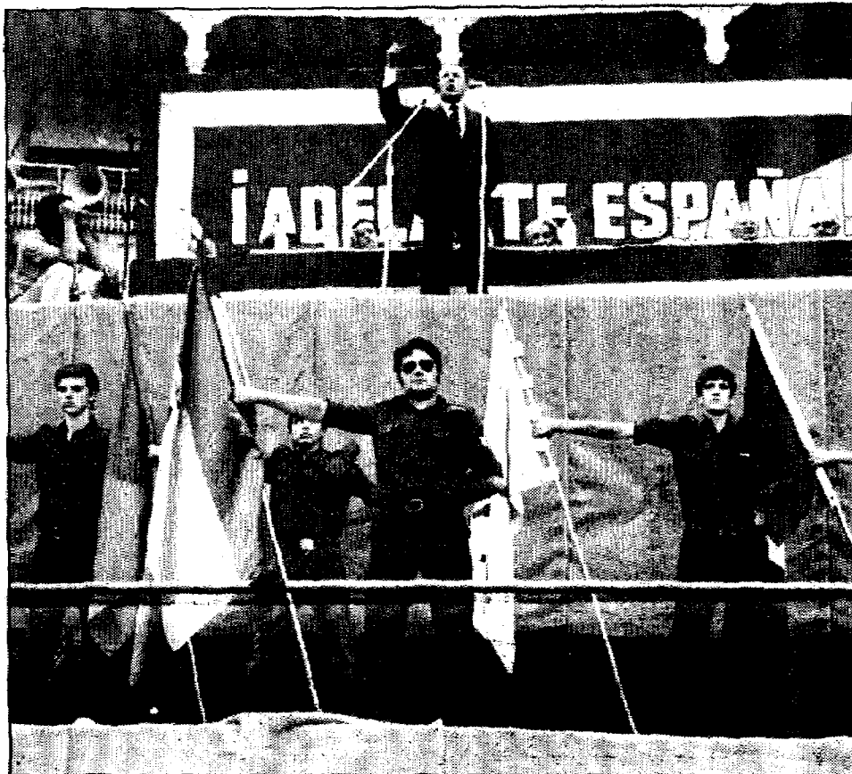
El «aparato» paramilitar no acompañará este año a Blas Piñar.

De cara a garantizar el orden público, además del servicio de orden, un millar de policías nacionales vigilarán la zona. Por otro lado,