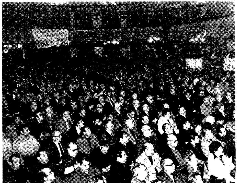
Cerca de un millar de falangistas llenaron el aforo del Teatro Calderón.