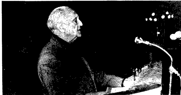
Raimundo Fernández Cuesta centró sus palabras, por encima de todo, en la unidad

guiente legislatura». Frente a ello, destacó que no caben soluciones tibias, faltas de rigor revolucionario necesario, «que reacomode a sus hombres en una