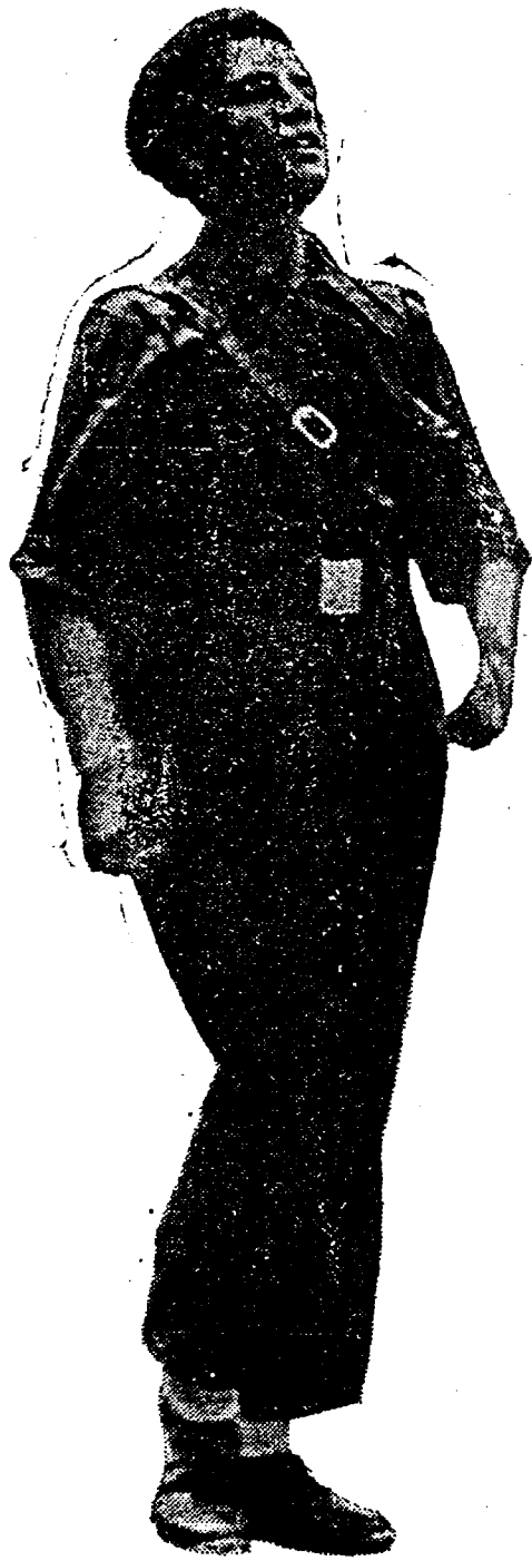
«Aquellos falangistas de la primera hora...»