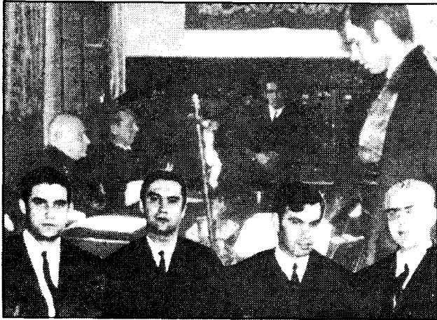
El líder socialista, tercera a la izquierda.