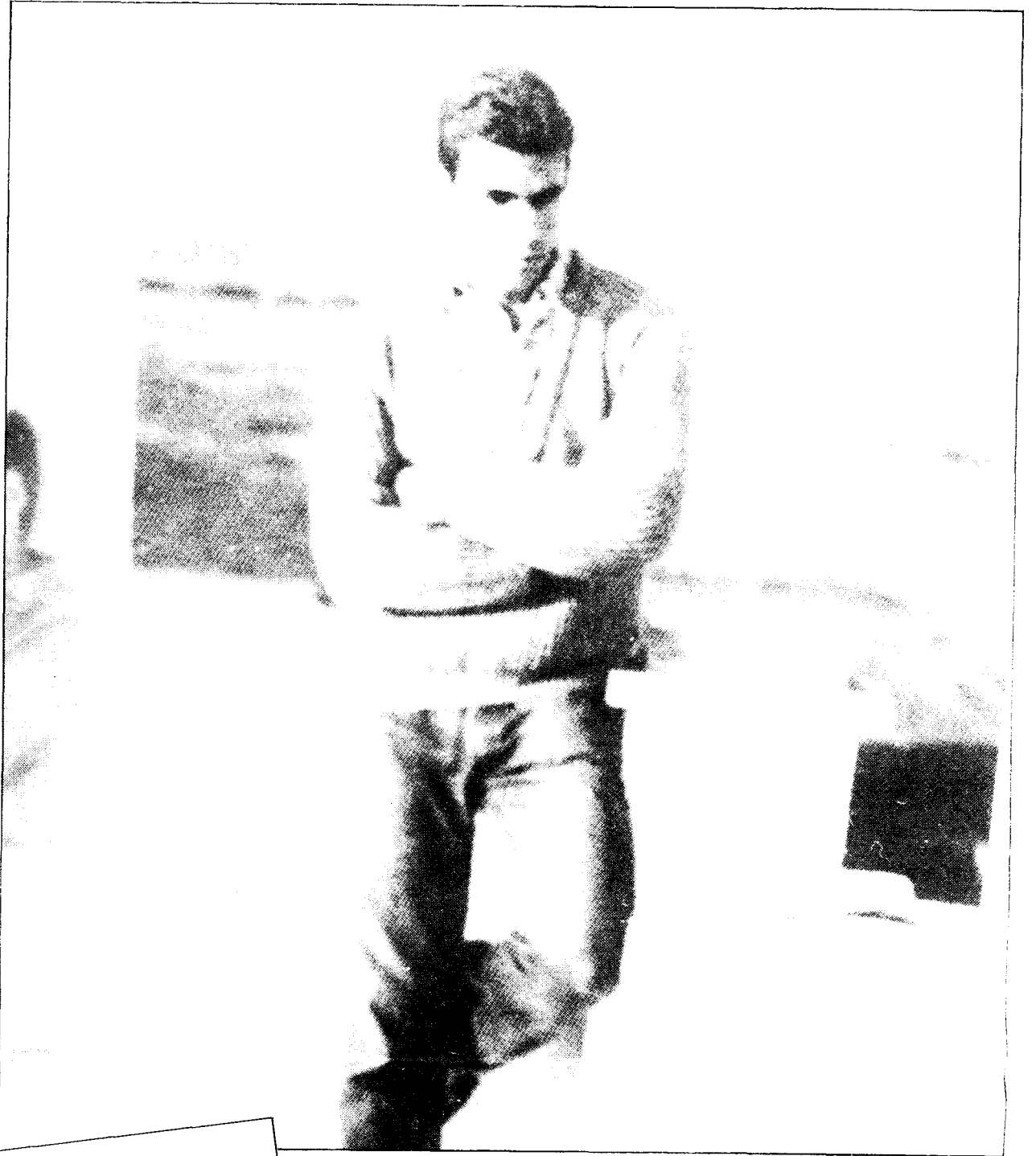
El actual presidente ya tenía ese carácter reconcentrado en su adolescencia.