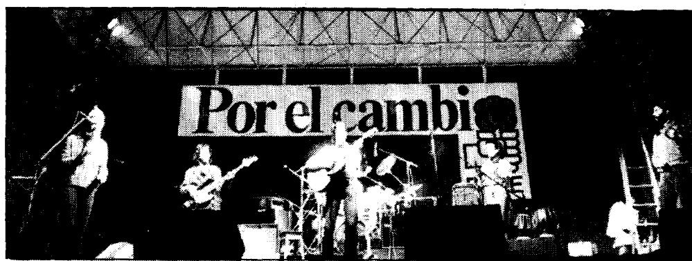
Los escenarios ocuparon diez mil metros cuadrados.