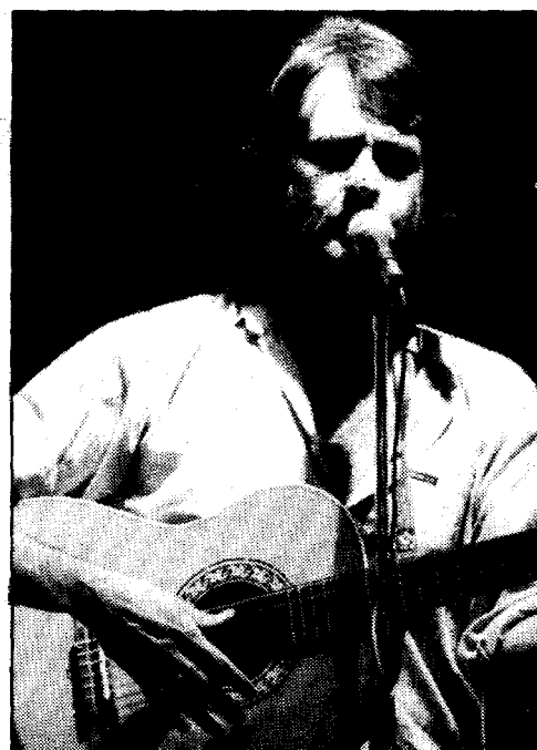
«Que el alba del 28 no sea como la canción.»