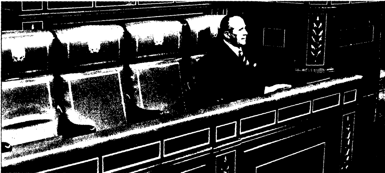
Arias Navarro espera en el «banco azul» del Gobierno a que los ministros empiecen a jurar sus cargos de procuradores.

Crónica del «Pleno del año» en las Cortes.