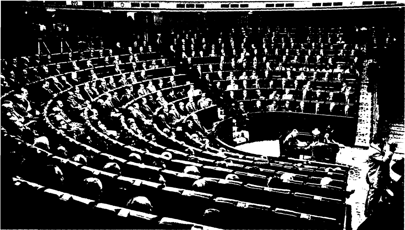
Una instantánea del hemiciclo de las Cortes.

reducirlos o evitarlos es incrementar la integración y participación de los trabajadores en el complejo mundo que constituye la empresa».