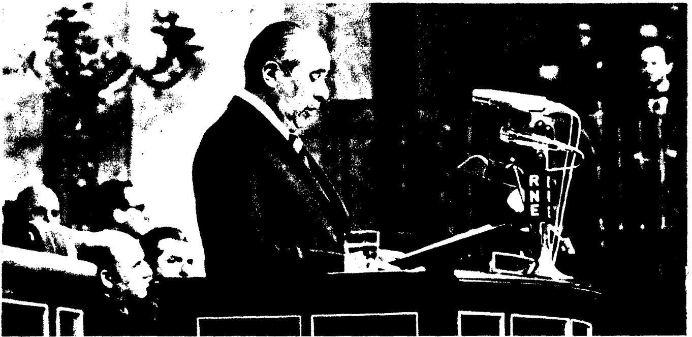
Arias Navarro, en un momento de su intervención ante el Pleno de las Cortes.