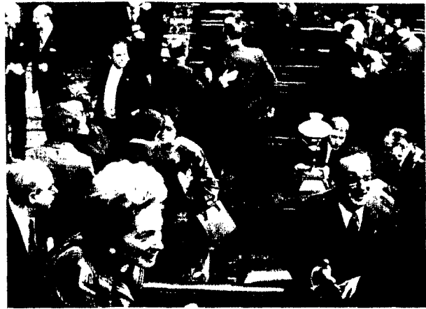
Animación en las Cortes, poco antes de la sesión.

REY: «El papel, las competencias y funciones del Rey están meridianamente definidos por las normas. En nuestro sistema, el Rey no sólo es representante supremo de la nación y personificación de la soberanía nacional, sino que tiene atribuidas