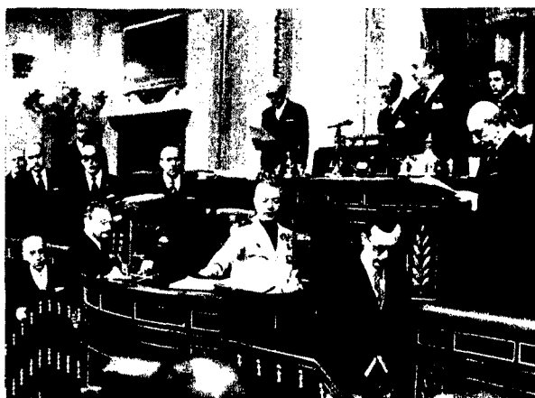
Los nuevos procuradores juran sus cargos.

INCOMPATIBILIDADES: (Anunciamos): «El desarrollo de la disposición transitoria, quinta del Reglamento de las Cortes, que impone al Gobierno la remisión a la Cámara de un proyecto de Ley que contemple y regule el régimen de incompatibilidades para el desempeño de la función parlamentaria».