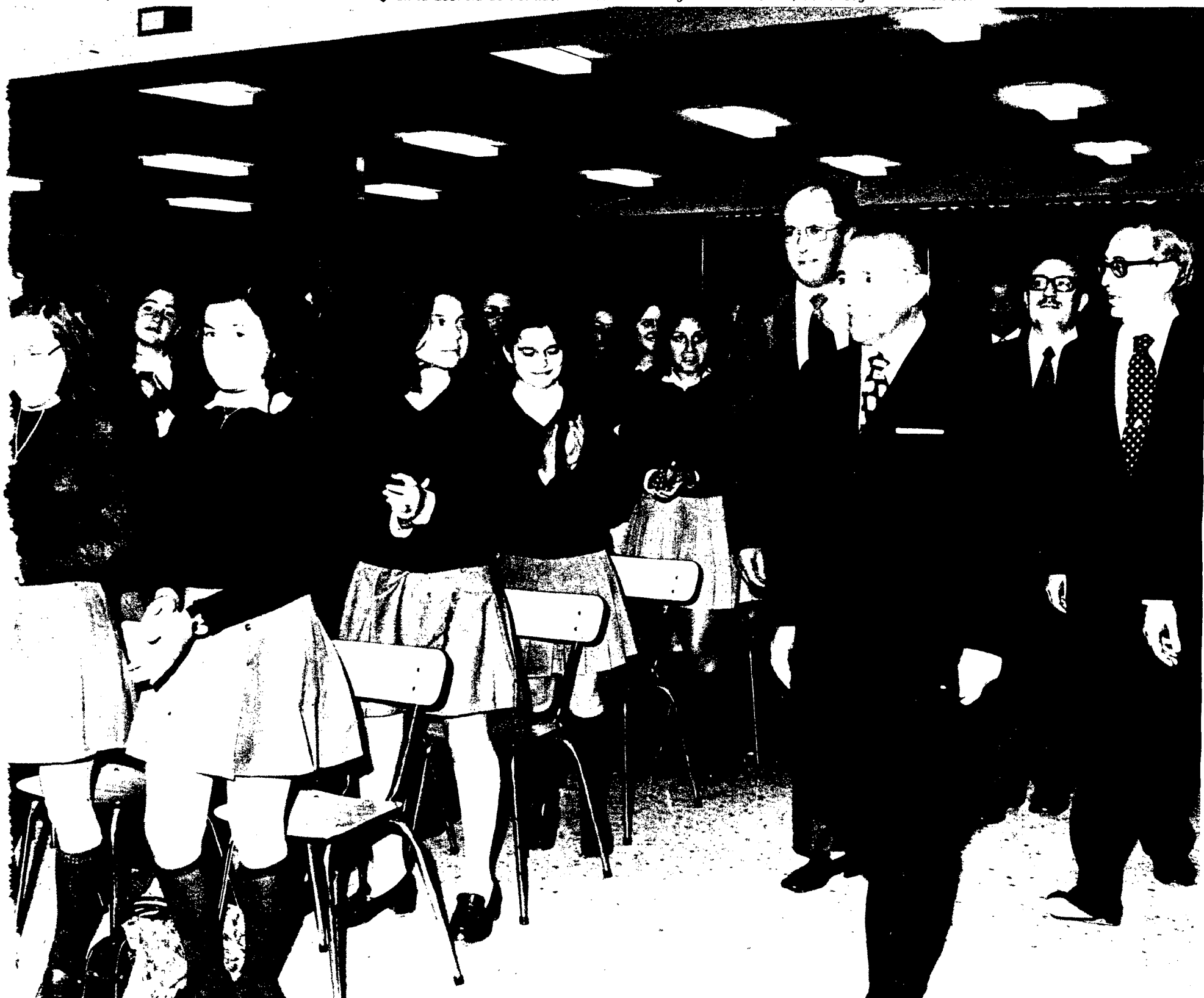
▼ En la Escuela de Formación Profesional Virgen de la Merced, de la Organización Sindical