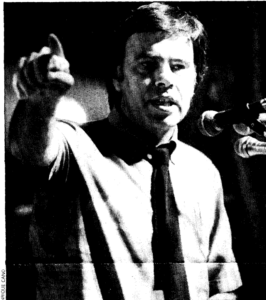
Fue su esposa, Carmen Romero, quien inventó el nombre de guerra —«Isidoro»— para la clandestinidad. Hoy, Felipe está a las puertas de la Moncloa.

niendo casi la misma cara de sorpresa que debió de quedarse cuando se encontró, de buenas a primeras, con el inesperado cargo entre las manos.