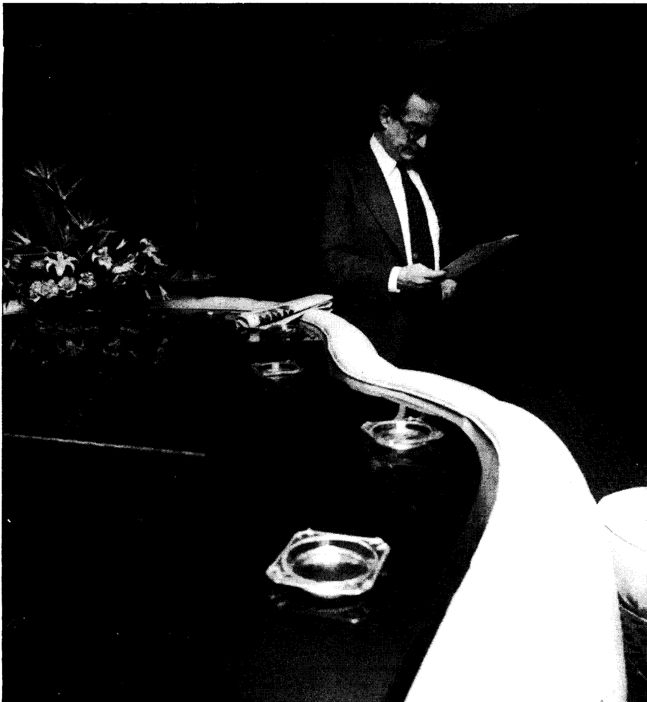
«Espero llegar bastante más lejos de lo que resulta en las últimas encuestas»

partido. Hay una serie de dinámicas internas que no sé en qué terminarán.