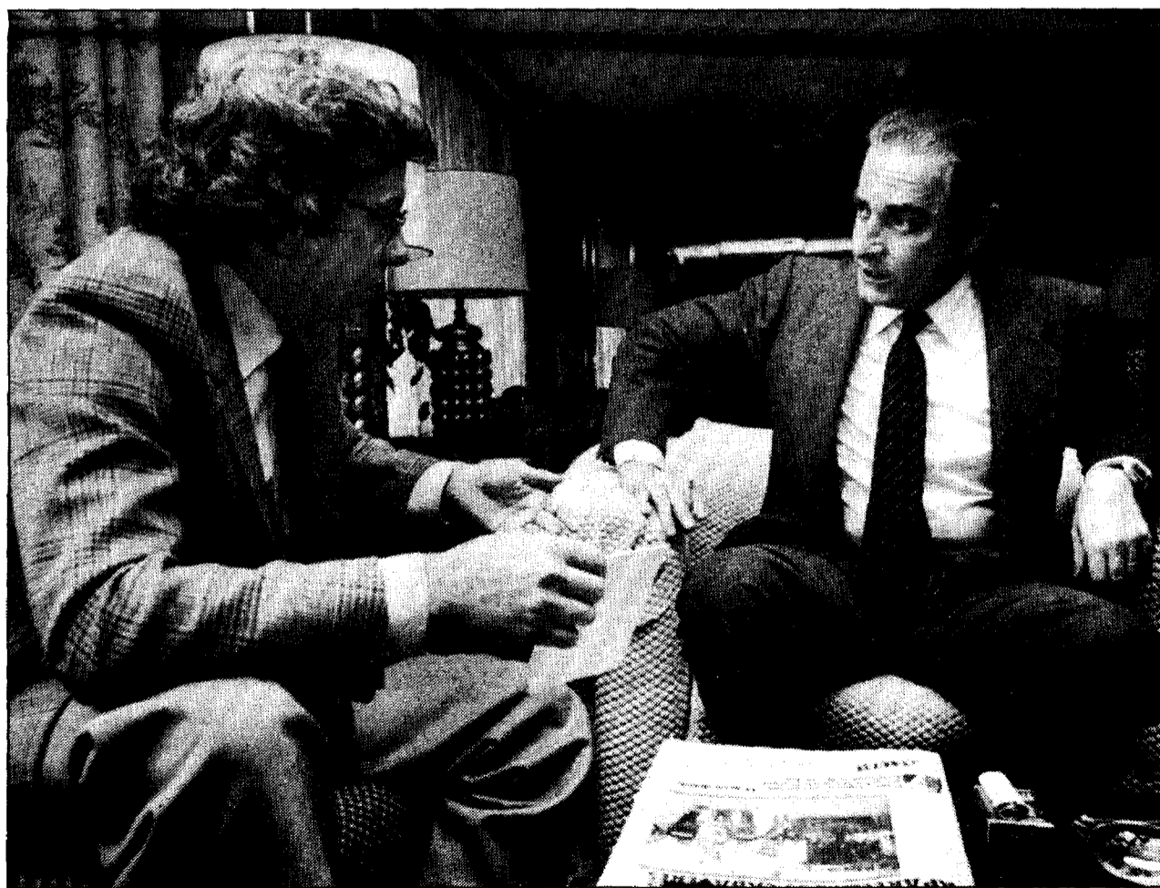
«En todos los comportamientos y en todas las actitudes hay una cuestión de consecuencia personal»

L. L. — Las circunstancias van colocando a las personas situaciones distintas. Para mí habría sido mucho más cómodo no haber aceptado el emble que se me hizo en el mes de junio, la presidencia del partido, cuando yo no aspiraba a ello. Ahora bien: tampoco puede uno operar sobre la base de decir «yo voy a preservar mi imagen, yo voy a preservar mi prestigio», porque el prestigio y la imagen están al servicio de las convicciones y esas convicciones a veces le sitúan a uno