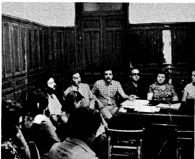
UN MOMENTO DE LA RUEDA DE PRENSA

Por otra parte, al parecer las JJ.SS., la J.G.R., la U.J.C.E. y otras organizaciones juveniles van a poner, en colaboración con los organizadores, mesas para recoger firmas en todo el país.