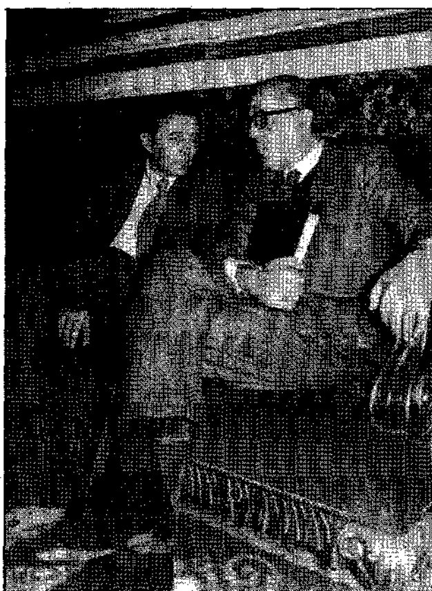
El presidente Leopoldo Calvo-Sotelo y el ministro de Defensa, Alberto Oliart, se reunieron con los generales después del Pleno.

Los periodistas catalanes entienden que nuestros Ejércitos no se identifican con los «propósitos desesta-