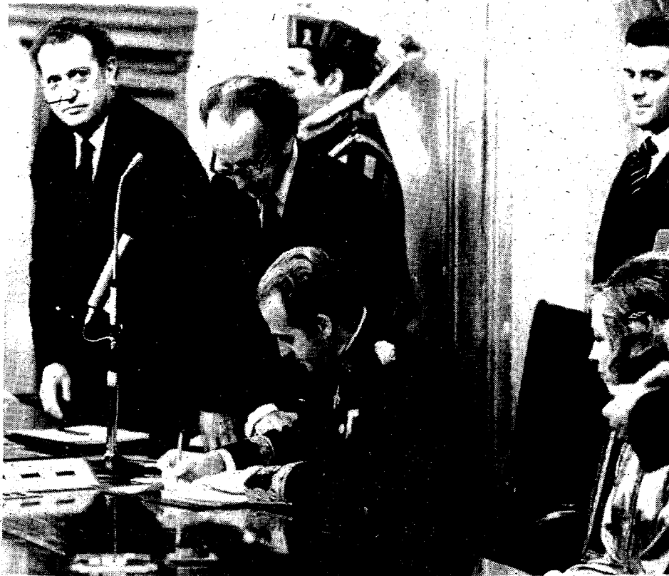
El acto solemne de la sanción de la Constitución por el Rey Juan Carlos, abrió una nueva etapa en la historia de España.

siste, por tanto, en garantizar la soberanía de España , soberanía que, según el artículo 1 de la Constitución, reside en el pueblo español, del que emanan los poderes del Estado. He aquí entroncados desde la más honda raíz de nuestra ley suprema las Fuerzas Armadas y el pueblo.