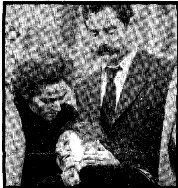
TENSION: El dolor y la presión nerviosa pudieron con la madre.