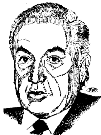
Jiménez de Parga

democracia supone el desmantelamiento del aparato anterior y crear uno nuevo que sirva de base para aquélla.» Citó seguidamente a Antonio Machado para referirse a dos clases de conservadores, «el que quiere conservar la salud y el que quiere conservar la sarna». Señaló la actual situación poco airosa del Gobierno y manifestó que «no le