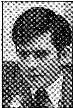
Enrique Barón Crespo