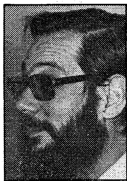
Javier Solana Madariaga