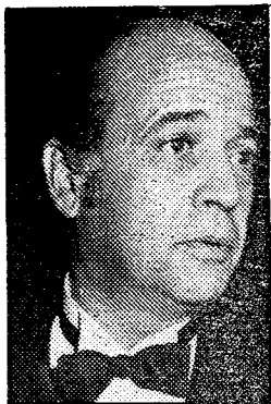
Francisco Fernández Ordóñez