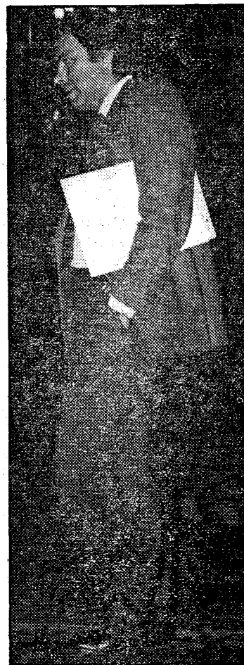
Felipe González Márquez

Madrid en las dos legislaturas anteriores.