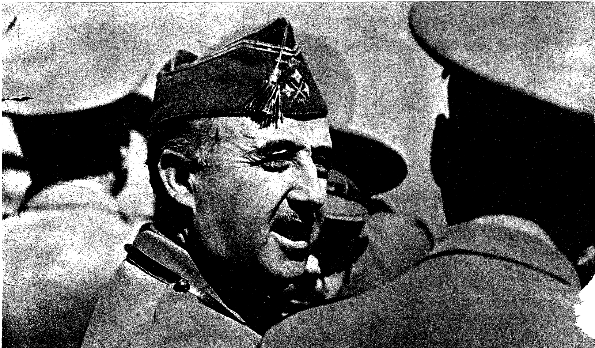
En la primavera de 1934, Madariaga, al que se quería nombrar ministro de Marina, se entrevista con Franco. «Me llamó la atención por su inteligencia concreta y exacta —ha escrito Madariaga— más que original o deslumbrante, así como por su tendencia natural a pensar en términos de espíritu público, sin ostentación alguna de hacerlo»