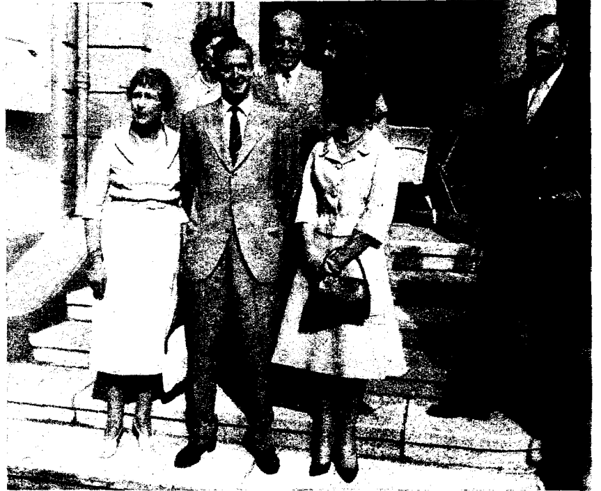
Sus Altezas Reales don Juan Carlos y doña Sofía rodeados de su familia el día que anunciaron su compromiso matrimonial.