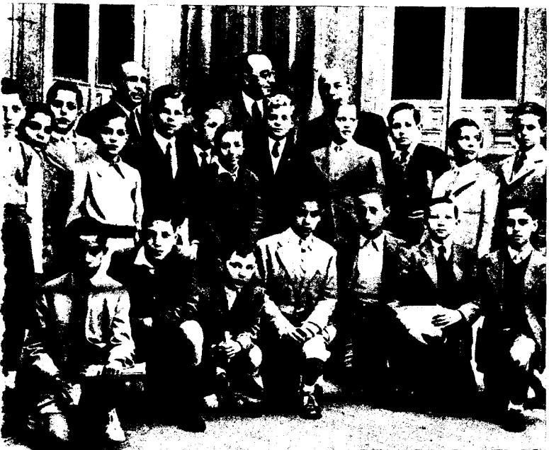
Don Juan Carlos rodeado de sus compañeros y algunos profesores del Instituto de San Isidro, de Madrid.