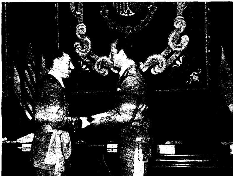
Don Juan Carlos entrega el fajín de capitán al número uno de la promoción 1968 en el Estado Mayor del Ejército.