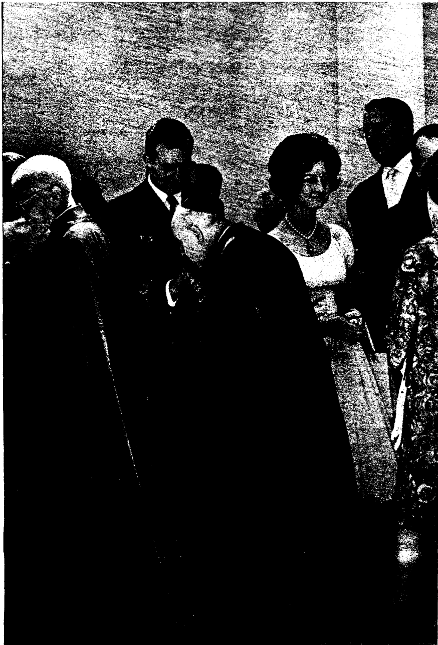
Don Juan Carlos y doña Sofía reciben el saludo de la jerarquía eclesiástica poco después de comunicar su compromiso matrimonial.