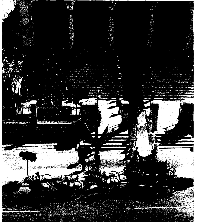
La princesa Sofía hace su entrada nupcial en la catedral católica de Atenas del brazo de su padre el rey Pablo de Grecia.

de Holanda y Alejandra de Kent, todas las cuales estaban por entonces solteras. Días difíciles vendrían luego para la monarquía de los Sondeburgo-Glucksburgo (la casa real griega), pero aquellos fueron sin duda uno de los más felices. Después de dar la vuelta al mundo en viaje de bodas, la joven pareja se instaló en Corfú para pasar el verano: en Corfú es donde la famosa emperatriz de Austria, Sissi, tenía una villa (vendida más tarde al Kaiser) con la estatua de Heine (que el Kaiser substituyó por una estatua gigantesca de Aquiles); en Corfú la familia real griega tenía también una villa de descanso, Monrepos (donde, por cierto, nació el príncipe Felipe, el marido de la reina de Inglaterra), y es allí donde transcurrieron el verano los novios. A su regreso a España les esperaba el palacio de