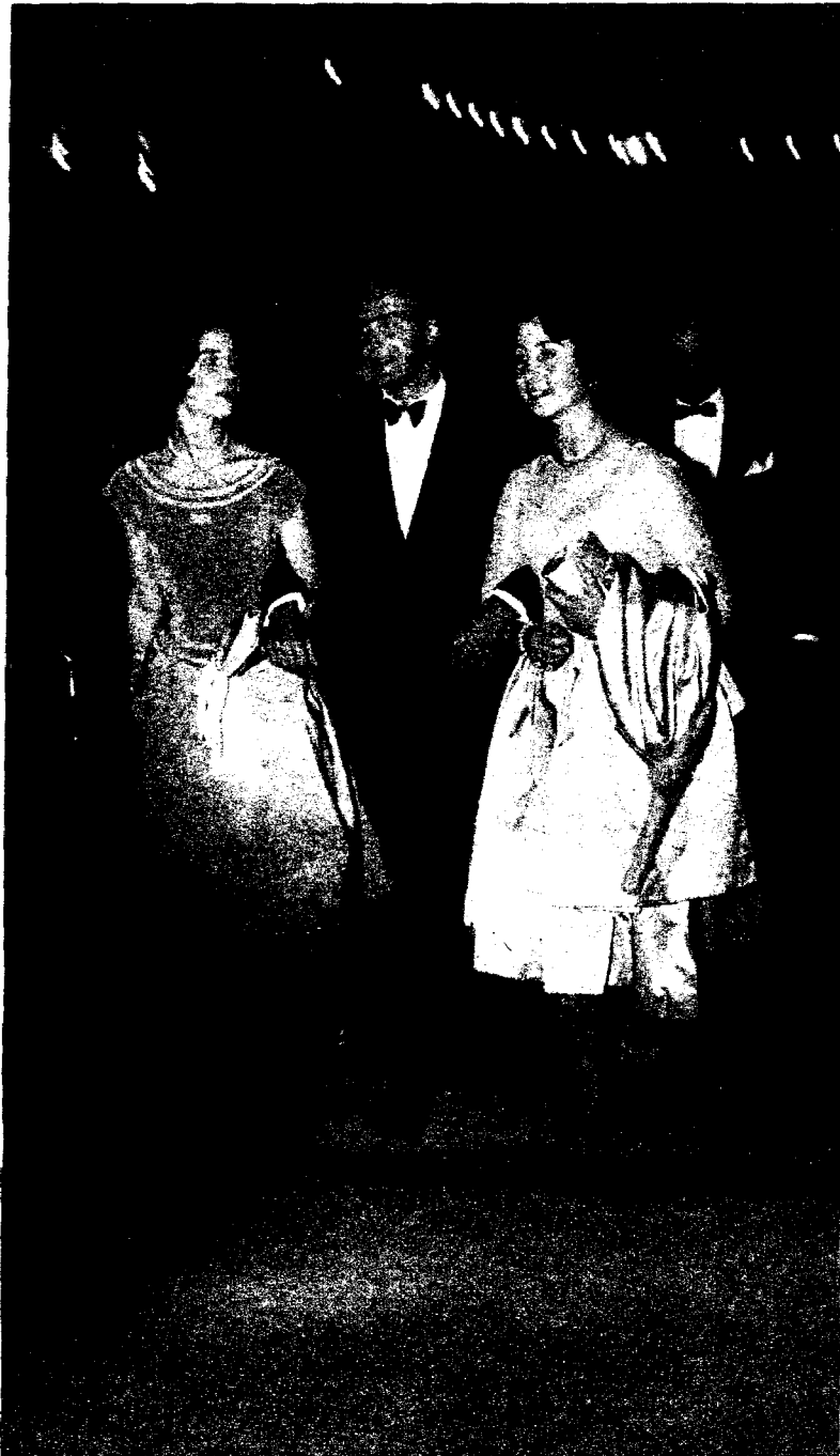
El Príncipe y las princesas Sofía e Irene de Grecia.