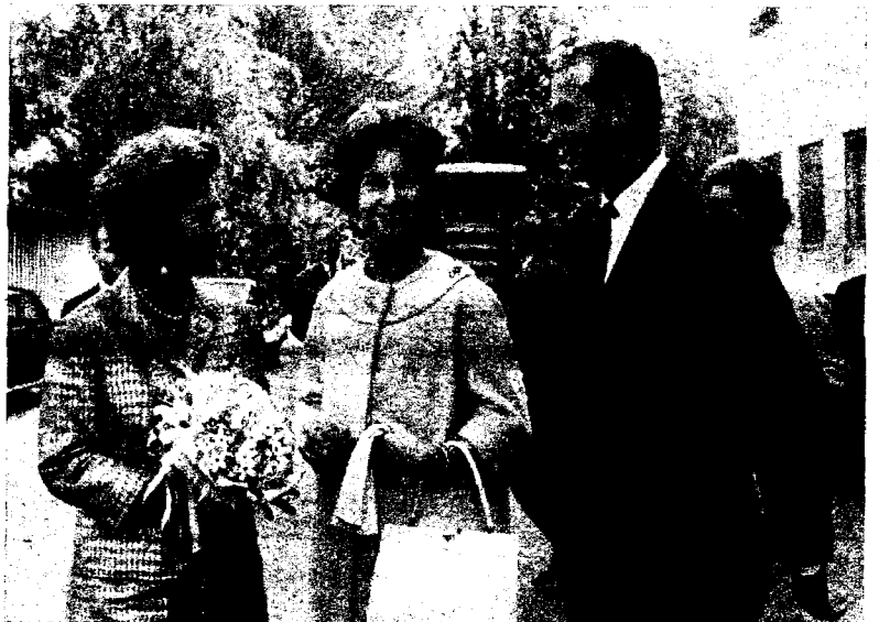
Con su futura esposa, la princesa Sofía y su madre la reina Federica, de Grecia, poco después de anunciar su compromiso matrimonial.

pa. Nieta del Kaiser Guillermo II, Federica está emparentada con la reina de Inglaterra; su marido, esto es, el padre de la princesa Sofía, procedía de las casas reales escandinavas y la influencia nórdica es todavía muy visible en Sofía. Su pasión por la música y su interés por la historia parecen provenir claramente de los Hohenzollern, así como su carácter fuerte y voluntarioso. Parece que doña Victoria, que por entonces residía en Laussane, vio con muy buenos ojos esta boda de su nieto con la princesa griega y que fue allí donde Juan Carlos entregó la pulsera de «pedida» a la que había de ser su futura esposa con unas palabras muy sencillas, que ella misma recordaría años más tarde: «Mi padre to-