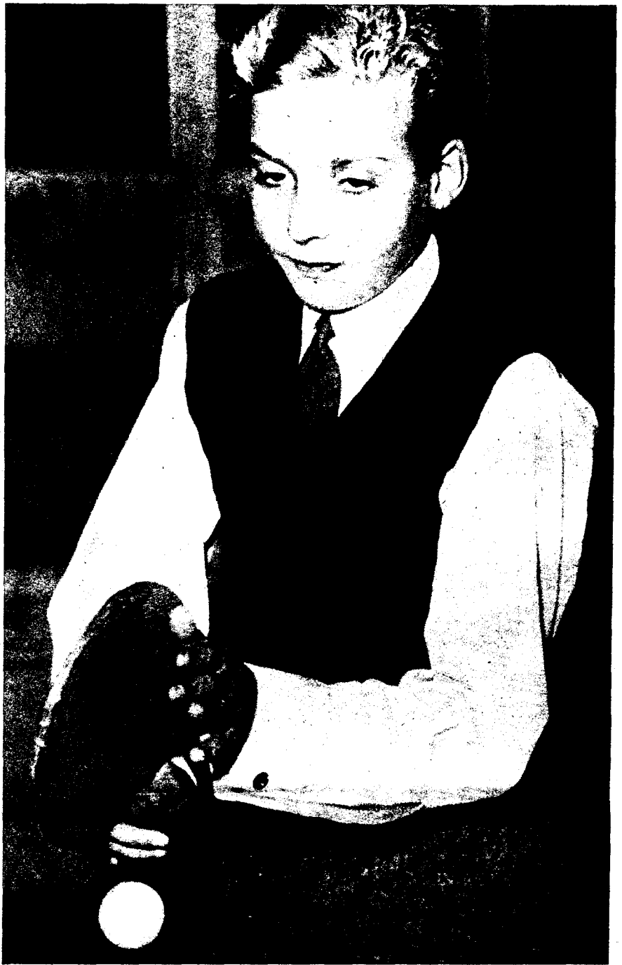
Desde muy pequeño, el Príncipe se aficiona a la práctica de los deportes. Aquí aparece practicando el tenis de mesa poco antes de partir hacia España para iniciar sus estudios de Bachillerato.

hallaba reunida en Estoril. Era el día de Jueves Santo. Doña María acababa de regresar de los Oficios y estaba quitándose la mantilla cuando oyó un disparo procedente del piso bajo de la casa, donde se hallaba instalada una sala de armas que hacía las veces de gimnasio. Los príncipes solían entrenarse disparando a un blanco. Juguetean-do con una pistola, don Alfonso había recibido en presencia de su hermano un balazo mortal en la sien.