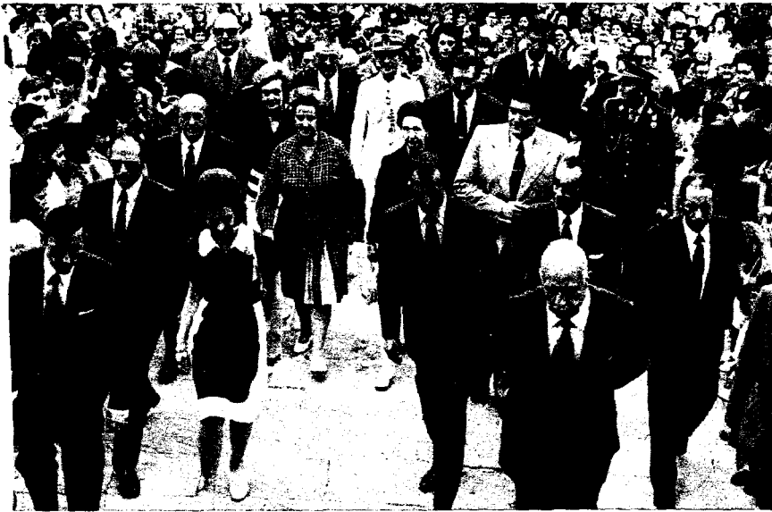
Don Juan Carlos y doña Sofía en las escalinatas que conducen al Santuario de Loyola, durante una visita que efectuaron a las provincias vascongadas en 1973.