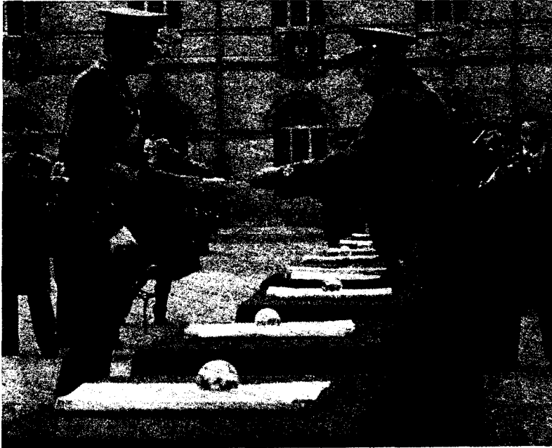
El 10 de diciembre de 1959 recibe los despachos de teniente de Infantería, alférez de navío y teniente de Aviación.