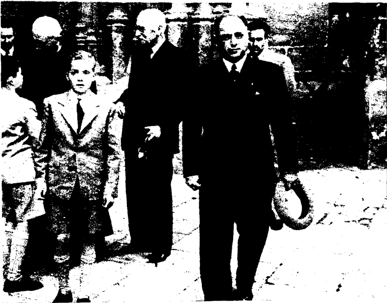
Don Juan Carlos y su abuelo materno —con bastón— ante el pórtico de la catedral de Sevilla en 1949.