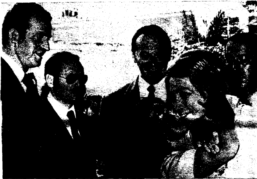
Doña Sofía recibe un abrazo emocionado y espontáneo de una obrera en una de las fábricas de conservas que visitaron durante su estancia en las provincias de Murcia y Albacete, en mayo de 1974.

de base». Se hacían cábalas luego sobre si no se trataba de una restauración, sino de una instauración, aunque se recordaba por otro lado, echando la vista muy atrás, que las dos instauraciones más recientes, la de los Borbones, en el siglo XVIII y la de los Saboyas en el XIX habían sido, la una muy costosa en sangre, la otra, un fracaso. Pero «los pueblos —seguía diciendo "Tele/eXpress"— no discuten como en el siglo pasado por principios, sino por resultados. No les importa la forma, República o Monarquía, sino la eficacia». Y recordaba el mencionado diario las monarquías socializantes de Suecia, Inglaterra, Holanda, etcétera. «La Voz de Avilés» daba un tinte levemente irónico a este proceso en el que se había llegado hasta el hijo saltando sobre el padre y decía que... «los derechos de