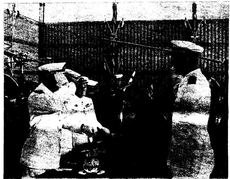
En la Academia General del Aire de San Javier obtuvo el título de piloto militar, correspondiente a la XIII Promoción en el curso 1958-59.

ción para el almuerzo, el programa diario. Los sábados y los domingos, asueto. Era el día en que el Príncipe aparecía por la casa de un general amigo de su padre, iba directamente a la cocina, abría la «nevera» y gritaba: «¿Qué hay para merendar?», ante el asombro de las criadas y las sonrisas de las hijas del general. En los años subsiguientes se vería claro que aunque la militar no era la carrera que había elegido, sino simplemente la que se le había impuesto, sus gustos y aficiones encajaban a la perfección con este modo de vida. Pero la Academia General no fue su única experiencia en este terreno. Al Príncipe se le exigía ser también marino y aviador. Tras una estancia en la escuela