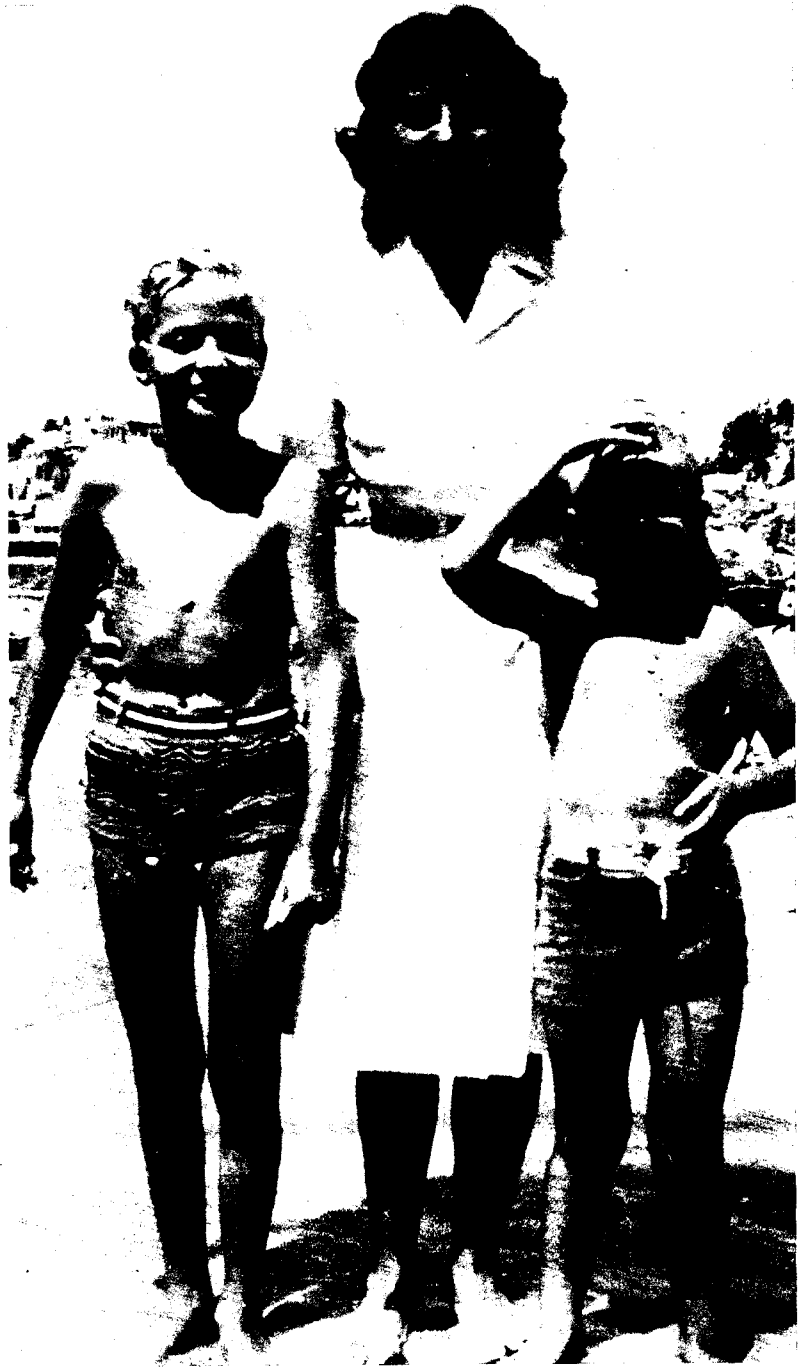
Con su hermano Alfonso durante unas vacaciones estivales en las playas de Estoril.

reales los jóvenes príncipes se ven distanciados de sus padres muchas horas al día; pero en el caso del joven Príncipe de España este distanciamiento tenía que ser forzosamente mayor. Compárese, por ejemplo, con la vida que por entonces hacía su futura esposa; aun habiendo pasado épocas muy difíciles —la guerra, los bombardeos alemanes, la huida a Egipto— doña Sofía no se vio separada nunca de su familia; con sus padres y hermanos recorrió los difíciles caminos del destierro, con ellos volvió luego a su país. Juan Carlos, nacido en el destierro (en 1938, en Roma), volvía solo a su país para ser custodiado y preparado por fieles amigos y excelentes profesores pero, en suma, por gentes ex-