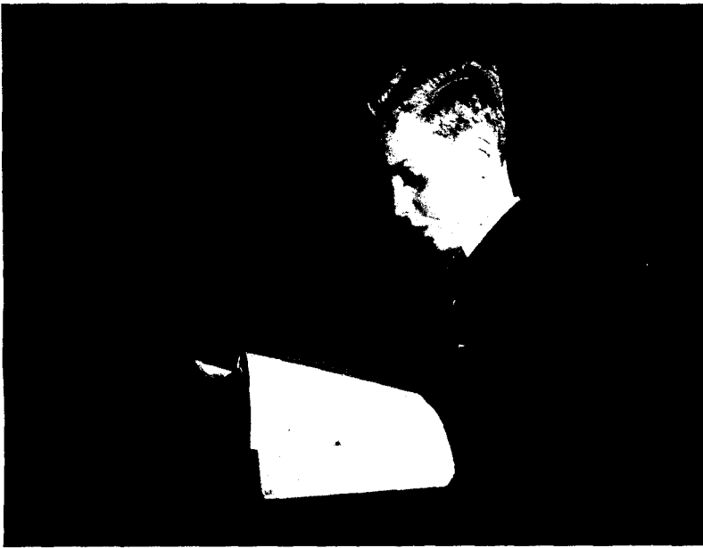
El joven Príncipe realizó sus estudios primarios en Lausanne. Poco después ingresó en el Instituto San Isidro, de Madrid, donde aparece exponiendo oralmente uno de sus exámenes de Bachillerato.