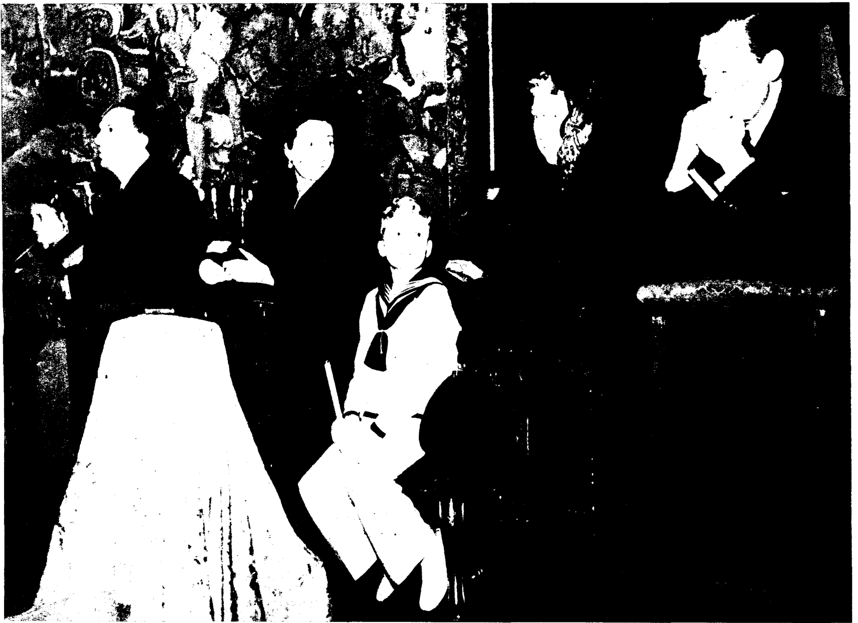
El infante don Juan Carlos, sus padres, su abuela, la reina Victoria Eugenia, y el rey de Italia, Humberto, el día que recibió su primera comunión en Lisboa, en enero de 1947.

nes que en adelante iban a recaer sobre él y una anécdota poco divulgada revela cuán difícil le era ya a esa edad temprana conservar un poco de libertad. En cierta ocasión parece que todo el séquito se puso en conmoción porque el Príncipe había desaparecido. Agil, vigoroso y osado para todo lo que fuere riesgo físico, cualidades de las que habría de dar buena muestra más tarde, el Príncipe había trepado simplemente a la copa de un pino y desde allí contemplaba, asombrado, el desbarajuste que su breve ausencia había producido en quienes