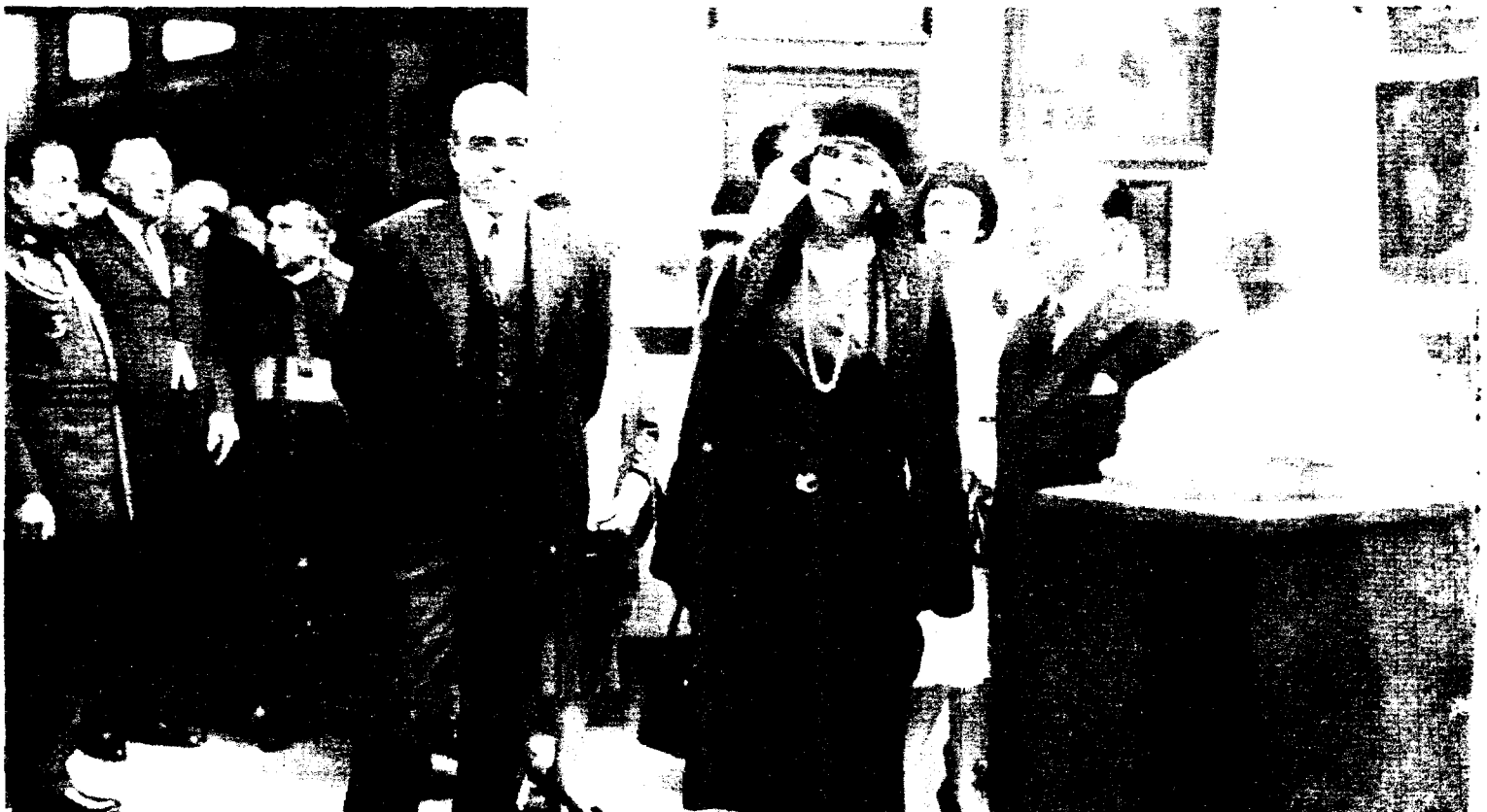
En octubre de 1929, los Reyes visitaron la Exposición Iberoamericana en Sevilla. Se ve a Doña Victoria Eugenia (1) en el pabellón de Chile. Al fondo, el entonces presidente del Consejo, don Miguel Primo de Rivera (2), y el conde de Xauen (3).