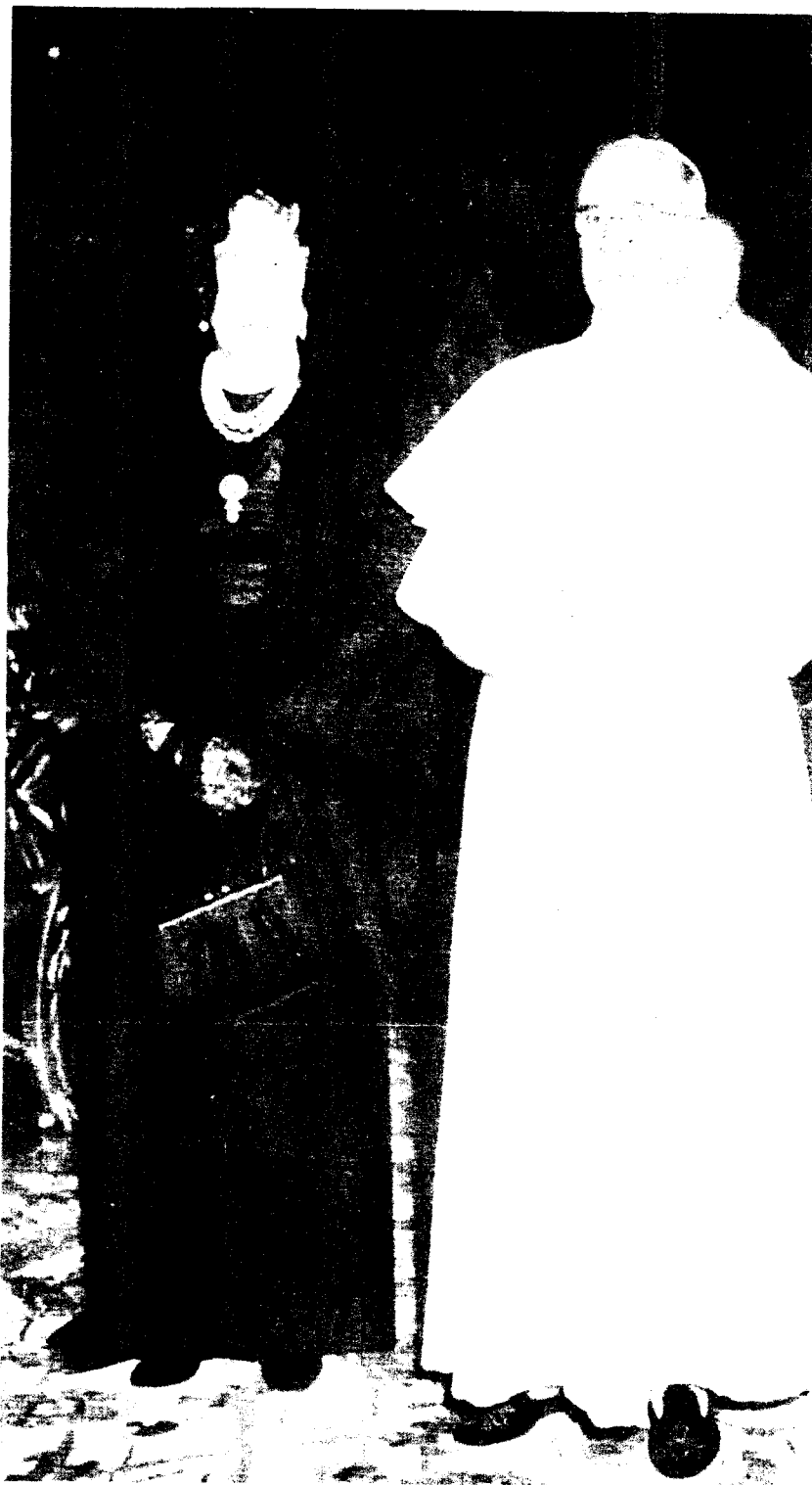
Con el Papa Pío XII, en el año 1958, al término de la audiencia concedida en el Vaticano a la Augusta Señora.