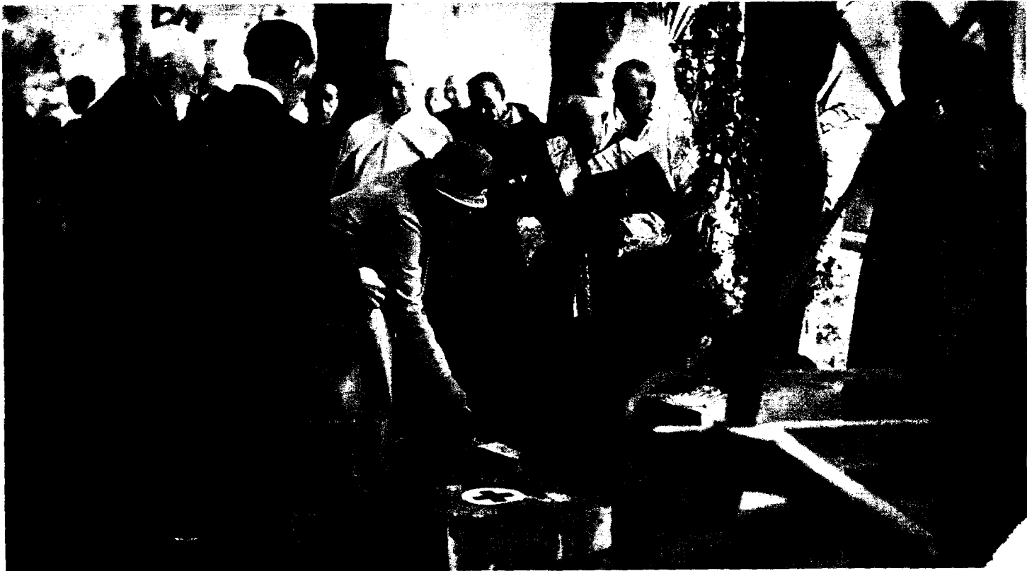
La Reina de España, en el acto de colocación de la primera piedra del Hospital de la Cruz Roja, de San Sebastián.