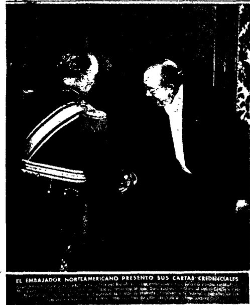
El 1 de marzo de 1951, Mr. Stanton Griffis, embajador norteamericano ante el Gobierno de Madrid, presenta sus cartas credenciales.