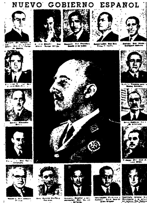
El 19 de julio de 1951 hay cambios en el Gobierno. Luis Carrero Blanco aparece ya como ministro subsecretario de la Presidencia.

Don Alvaro de Figueroa, conde de Romanones, muere