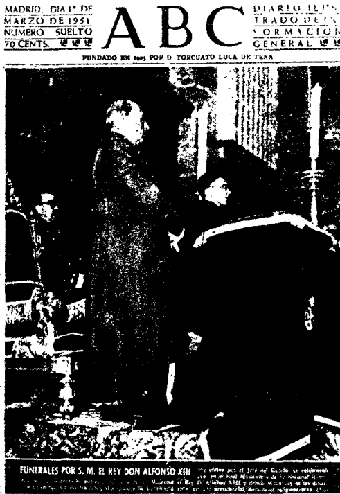
El 28 de febrero de 1951, Franco presidía los funerales que por Su Majestad Alfonso XIII se celebraron en el Monasterio de El Escorial.