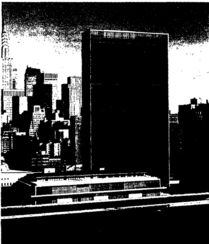
En octubre de 1950, la O.N.U revoca el acuerdo de 1946 que recomendaba la retirada de embajadores de Madrid. Por primera vez, los Estados Unidos votaban a favor de España.

El Pardo en julio, dos días antes del cambio de ministros. Aunque el primer acuerdo hispano-norteamericano no se establezca hasta 1953, las bases del convenio —nunca mejor dicho— están sentadas. Y este acercamiento a Washington significa un respiro para el Régimen español, que ha sostenido mucho tiempo un asfixiante cerco de hostilidad.