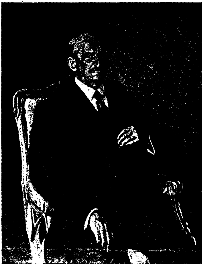
El 11 de septiembre de 1950, fallece don Alvaro de Figueroa, conde de Romanones, un político de casi permanente presencia en todos los gobiernos de la Monarquía.