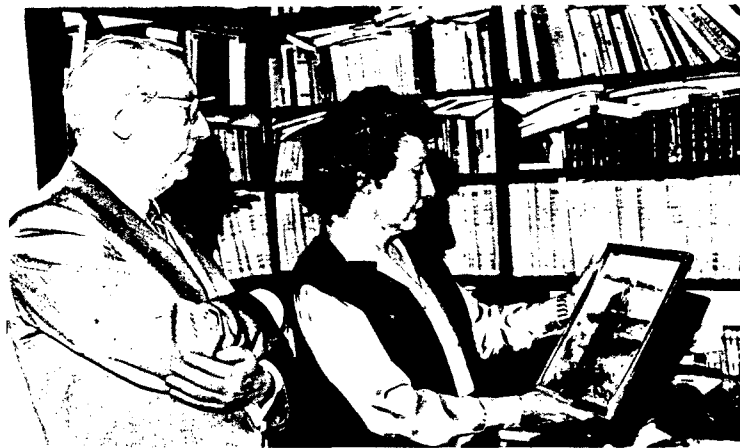
En esta página, dos imágenes del matrimonio Tierno. El profesor dice: «Sería partidario del regreso a España de todos los exiliados políticos que acepten la democracia, y cuanto antes mejor...».

—Yo creo que el señor Carrillo aceptaría venir y respetar las normas de una contienda democrática. Sería un paso adelante que permitiría a los españoles acabar de una vez con miedos míticos al tener completo el panorama político del futuro. Y creo, además, que sería el comienzo de una reconciliación total, para una convivencia plena y ordenada. En éste, como en todos los asuntos, debemos pensar más en la