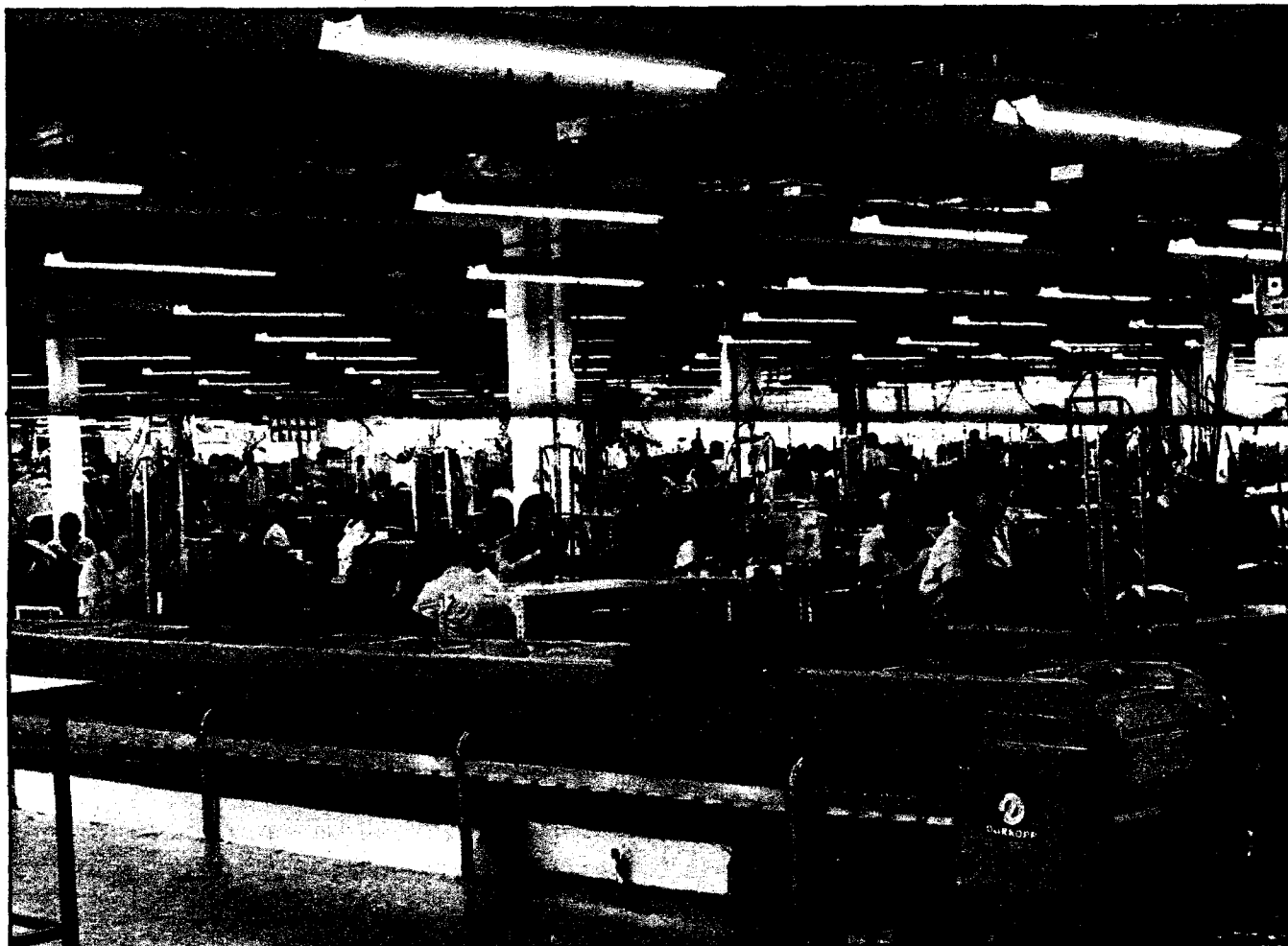
El 45 por 100 de las mujeres que se dedican a la confección tienen menos de veinticinco años

en grandes industrias, donde la mano artesana de la costurera brilla por su ausencia y el trabajo en cadena reemplaza al lento y minucioso de la confección a mano.