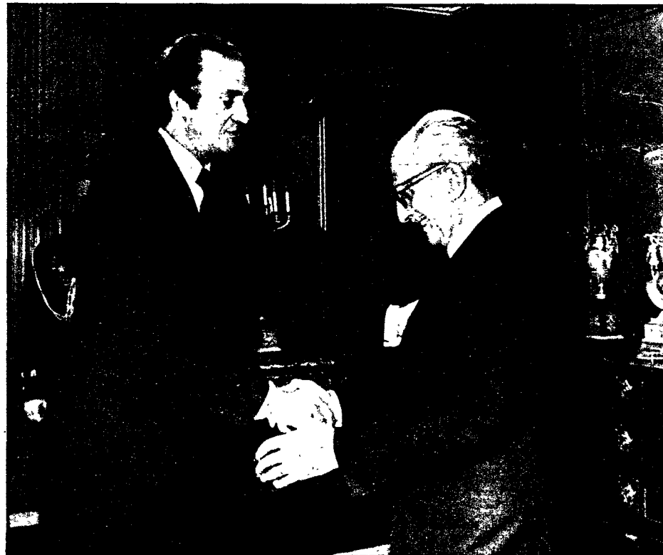
Con el vicepresidente para Asuntos de la Seguridad, teniente general Gutiérrez Mellado