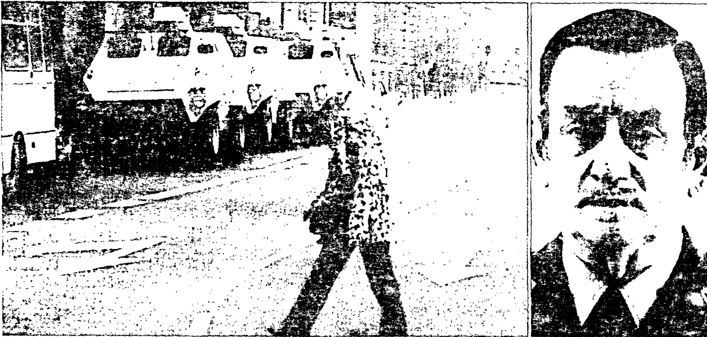
El general León Pizarro (foto de la derecha) fue sustituido como jefe de la División Maestrazgo 3 tras los sucesos del día 23. Tanquetes de la Policía Nacional, imagen de la izquierda, aparecen estacionadas en las proximidades del Congreso —pocas horas después de la toma de éste por el teniente coronel Tejero— en defensa de la Constitución y de la legalidad.

ganizó partidas de vigilancia en los accesos del pueblo, mientras que los vecinos se intercambiaban escopetas y cartuchos. El ambiente de tensión y autodefensa debió ser tal que el comandante de puesto de la Guardia Civil se presentó al alcalde para decirle que estaba a favor de la Constitución y que se ponía a sus órdenes.