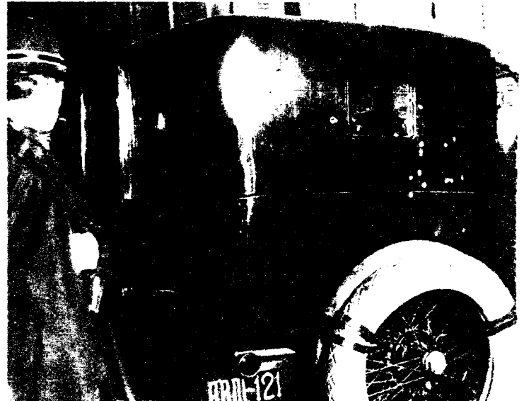
Este es el coche oficial en el que murió acribillado a balazos el presidente del Consejo de Ministros, don Eduardo Dato, el 8 de marzo de 1921. El crimen se consumó en la plaza de la Independencia, junto a la Puerta de Alcalá.