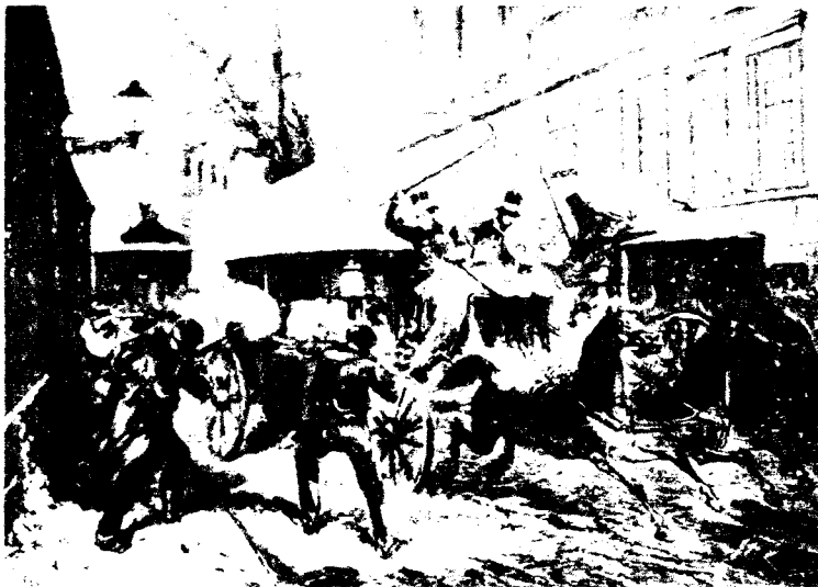
Atentado contra el general Prim la noche del 27 de diciembre de 1870 en la madrileña calle del Turco (hoy del Marqués de Cubas).