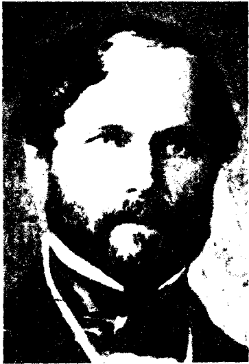
Juan Prim y Prats

En poco más de cien años, cuatro han sido los presidentes del Gobierno que han caído asesinados en España. Desde el asesinato del general Prim, en la noche del 27 de diciembre de 1870, fueron víctimas de inicuos atentados don Antonio Cánovas del Castillo, don José Canalejas Méndez y don Eduardo Dato Iradier.