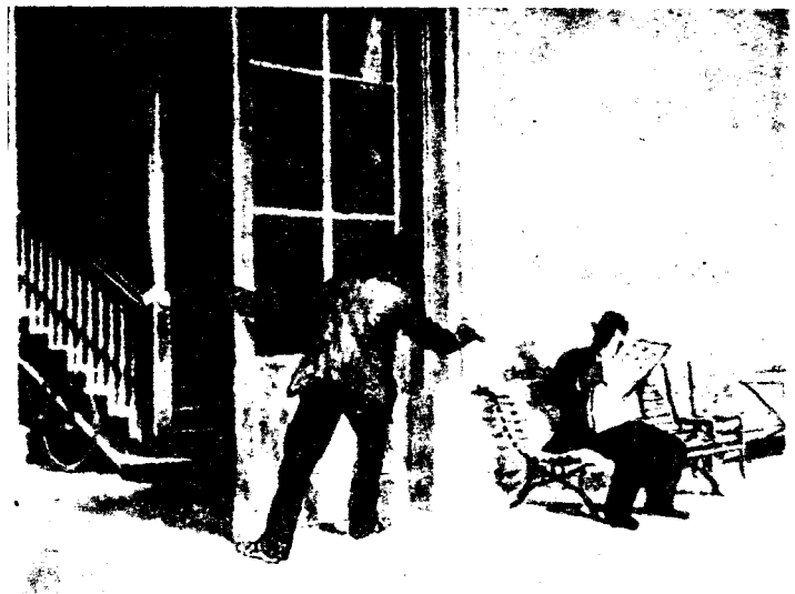
El anarquista Angiolillo asesinó el 8 de agosto de 1897 a don Antonio Cánovas del Castillo, en el balneario de Santa Agueda.