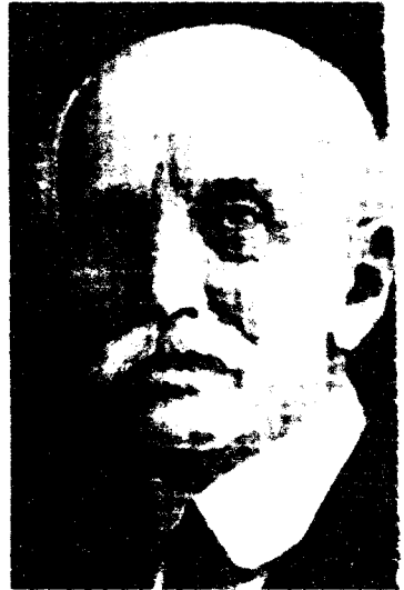
Eduardo Dato Iradier