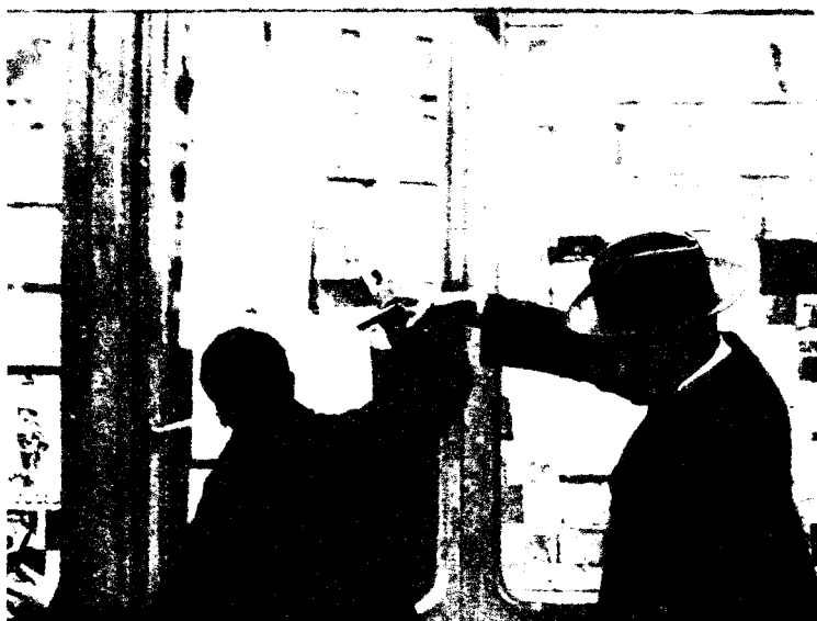
Reconstrucción del asesinato de Canalejas por el anarquista Pardiñas cuando miraba el escaparate de la librería San Martín, en la Puerta del Sol. Era el 12 de noviembre de 1912.