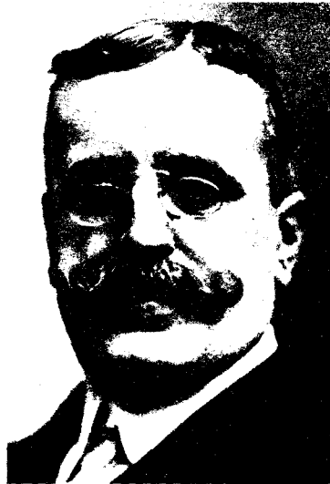
José Canalejas Méndez