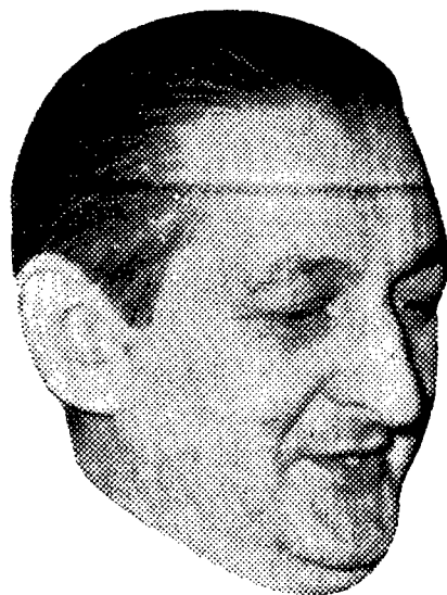
Don Torcuato Fernández Miranda ha asumido la Presidencia del Gobierno

El almirante Carrero Blanco contaba setenta años de edad y era presidente del Gobierno desde el pasado mes de junio.