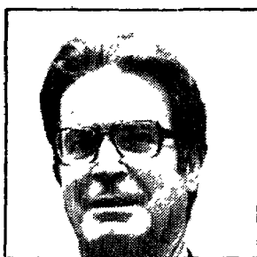
Garrigues y Lluís Llach se solidarizaron con DIARIO 16.