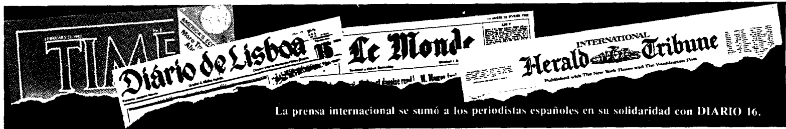
La prensa internacional se sumó a los periodistas españoles en su solidaridad con DIARIO 16.

Y así, llamadas y llamadas. Imposible reflejarlas todas o enumerarlas. La mayoría de ellas entrañablemente unidas. Como el grupo de quiosqueras de Gandía (Valencia) que anuncia que «hoy pondremos a