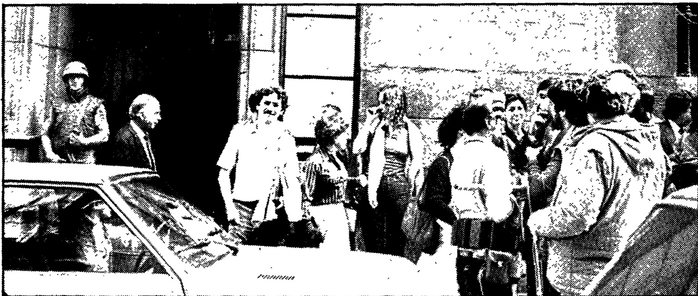
Numerosos informadores acudieron a la oficina de prensa del Ministerio de Defensa