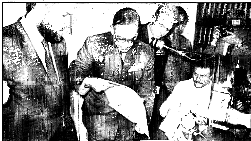
Momento en que se procede a la apertura del sobre que contiene la sentencia