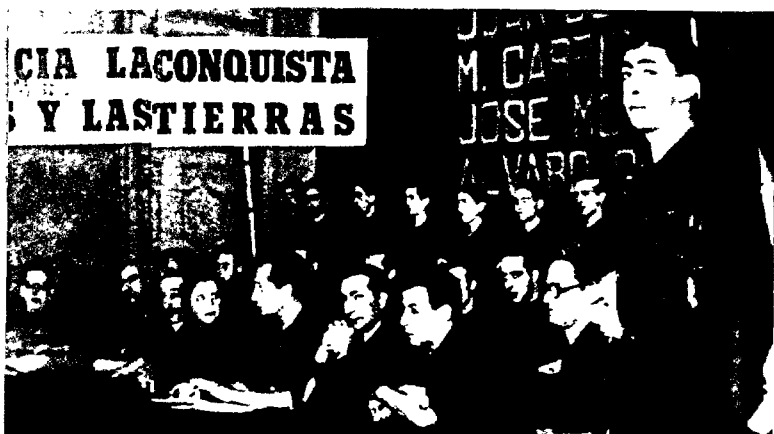
Acto político: José Antonio y Hedilla Fidelidad desde un principio

por vía de superación de todas las aportaciones al Alzamiento, justificada por una acción de gobierno eficiente, según dice el decreto.