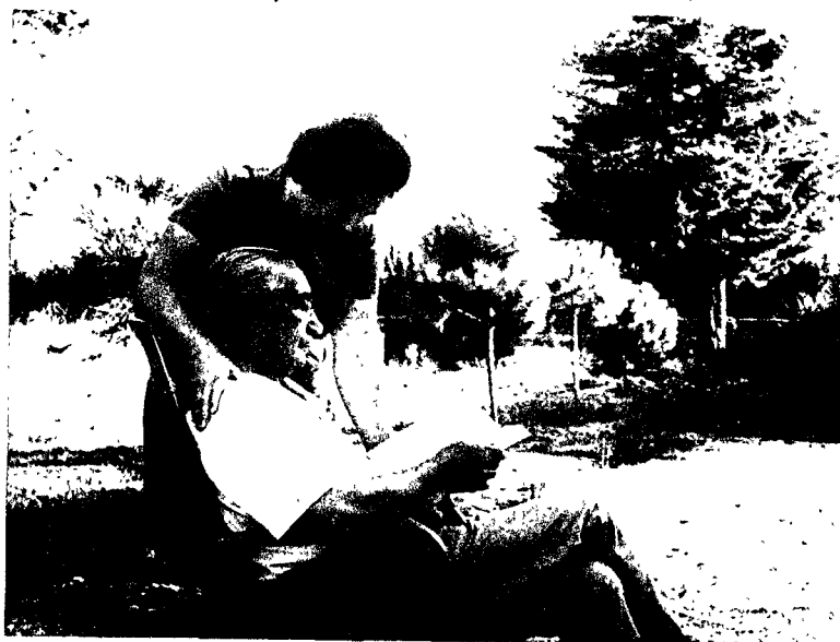
Con su esposa en Denia

La afirmación de que la doctrina de FE de las JONS propugnaba un régimen político no democrático, que es la proposición inserta en la pregunta, a mi juicio no corresponde a la realidad, a no ser que se entienda exclusivamente por democracia el sistema liberal parlamentario,