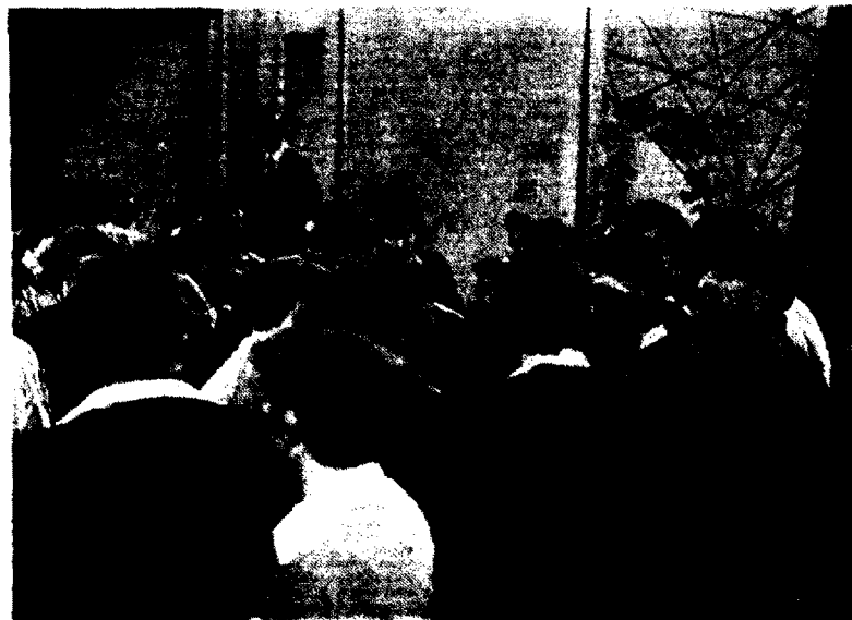
Un aspecto del local donde se celebraron las reuniones.