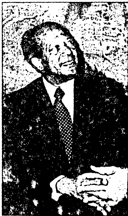
Todman El embajador removió las aguas sucias

España sería un extremo del arco defensivo ideado por Haig para la protección de los intereses occidentales amenazados por la crisis del Medio Oriente (ver recuadro) y así lo ha insinuado en Madrid. En varias ocasiones los EE. UU. han intentado, sin éxito, obtener autorización de España para que repostaran los aviones norteamericanos con objetivos en aquella zona.