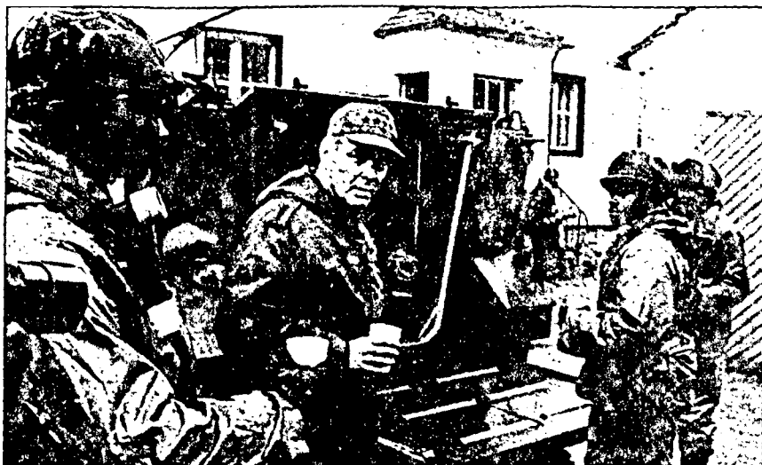
Haig, en la OTAN «Demasiado político»

no sólo para actuar como ministro de Asuntos Exteriores sino para que su departamento asumiera parcelas de los Ministerios de Defensa y Comercio, le estalló hace tres semanas en las narices a Haig.