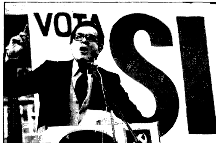
Tamames: Cristalización —¿provisional?— de una diáspora.

guardadas para que a ellas sólo tuviera acceso Carrillo y dos o tres más.