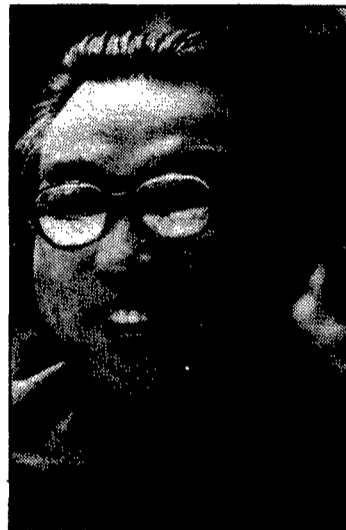
Kim Il Sung: Extrañas amistades.